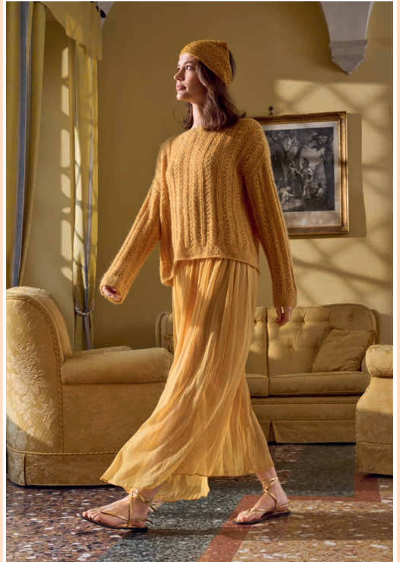
Modell 1: Che bello: Beim dottergelben PULLOVER ergeben Flausch, Pailletten und filigrane Strukturen eine entspannt-elegante Komposition. Das doppelfädig gestrickte Modell besteht aus SETASURI & GLAMOUR