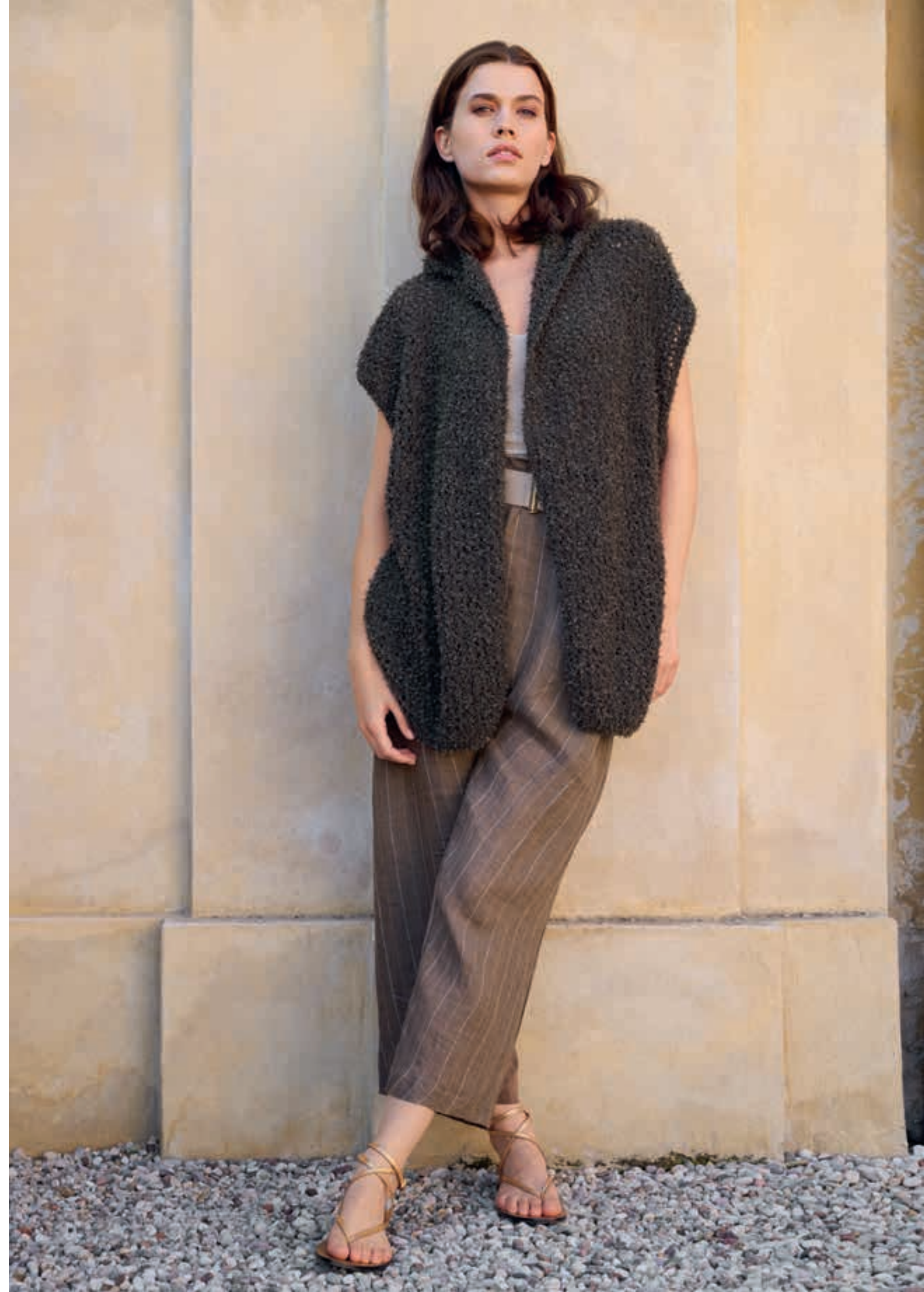
Modell 14: Garnneuheit Frizzante, hier in der Trendfarbe Mokka. Die WESTE hat eine Kapuze, die man im Vorderteil anstrickt und in der hinteren Mitte zusammennäht. FRIZZANTE