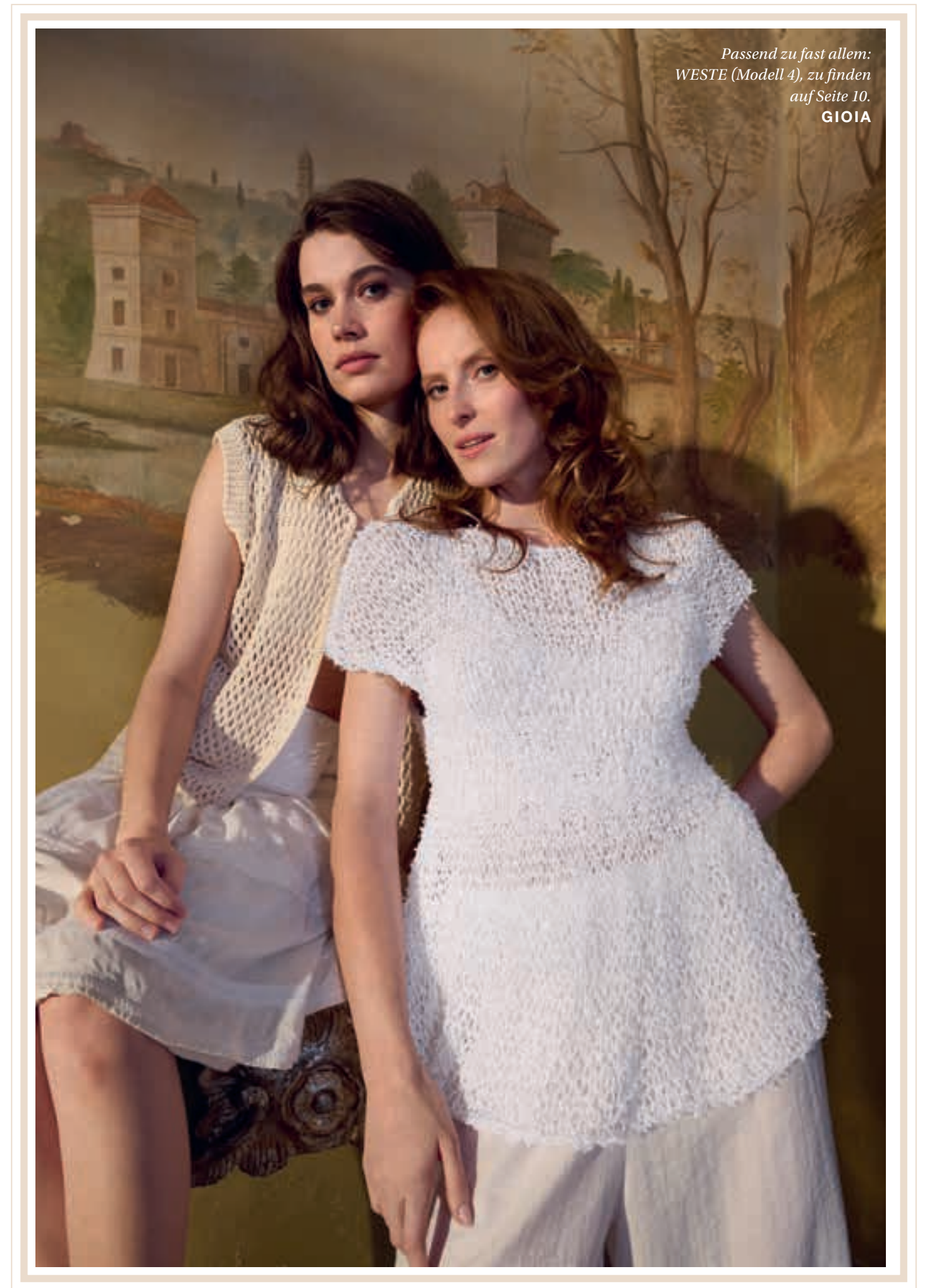
Modell 20: Beim Sorpresa: Unser TOP aus Garnneuheit Frizzante wurde nicht in Form gestrickt. Die überschrittenen Schultern und das angedeutete Schößchen entstehen – ganz einfach – durch den Einsatz dickerer Nadeln. FRIZZANTE & GLAMOUR