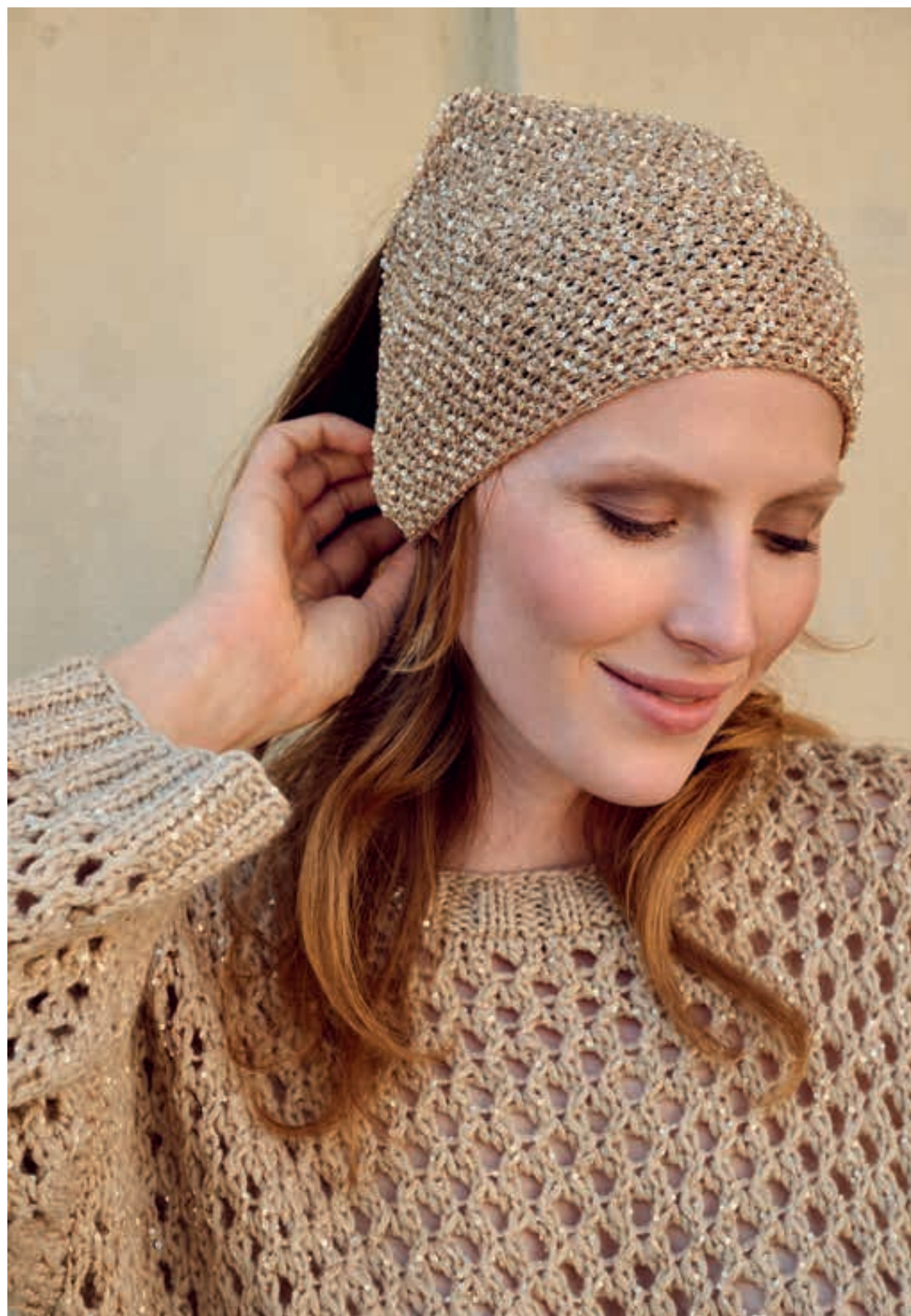
Modell 13: Weiches Schlauchgarn und eine paillettenbesetzte Qualität ergeben diesen luftigen Luxus-PULLOVER, der rund um die Uhr funktioniert. Infos zum KOPFTUCH finden Sie auf Seite 9. SUMMER SOFTNESS & GLAMOUR