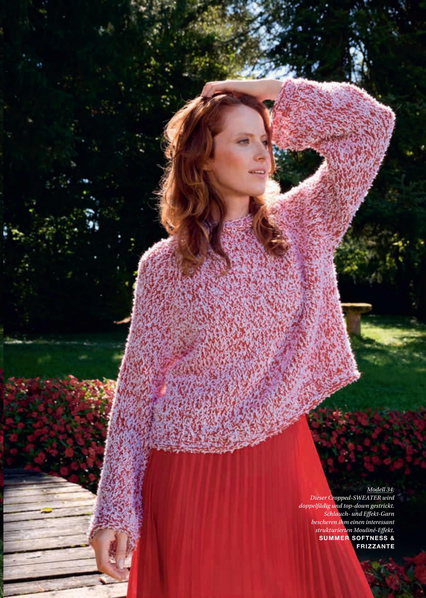
Modell 34: Dieser Cropped-SWEATER wird doppelfädig und top-down gestrickt. Schlauch- und Effekt-Garn bescheren ihm einen interessant strukturierten Mouliné-Effekt. SUMMER SOFTNESS & FRIZZANTE