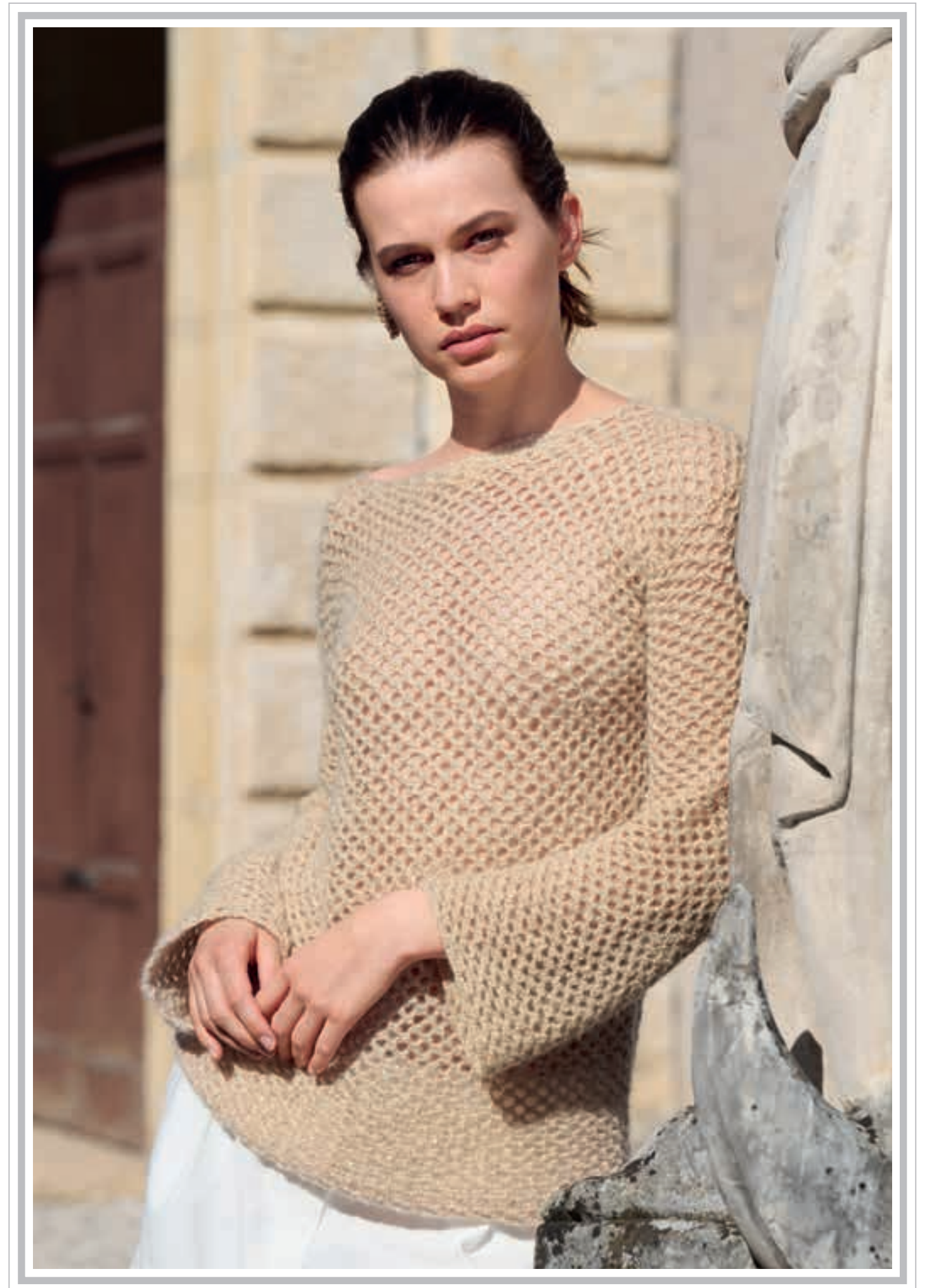
Modell 5: Flausch und Pailletten, dazu ein durchbrochenes Häkelmuster: Ein PULLOVER für Tag und Nacht. SETASURI & GLAMOUR