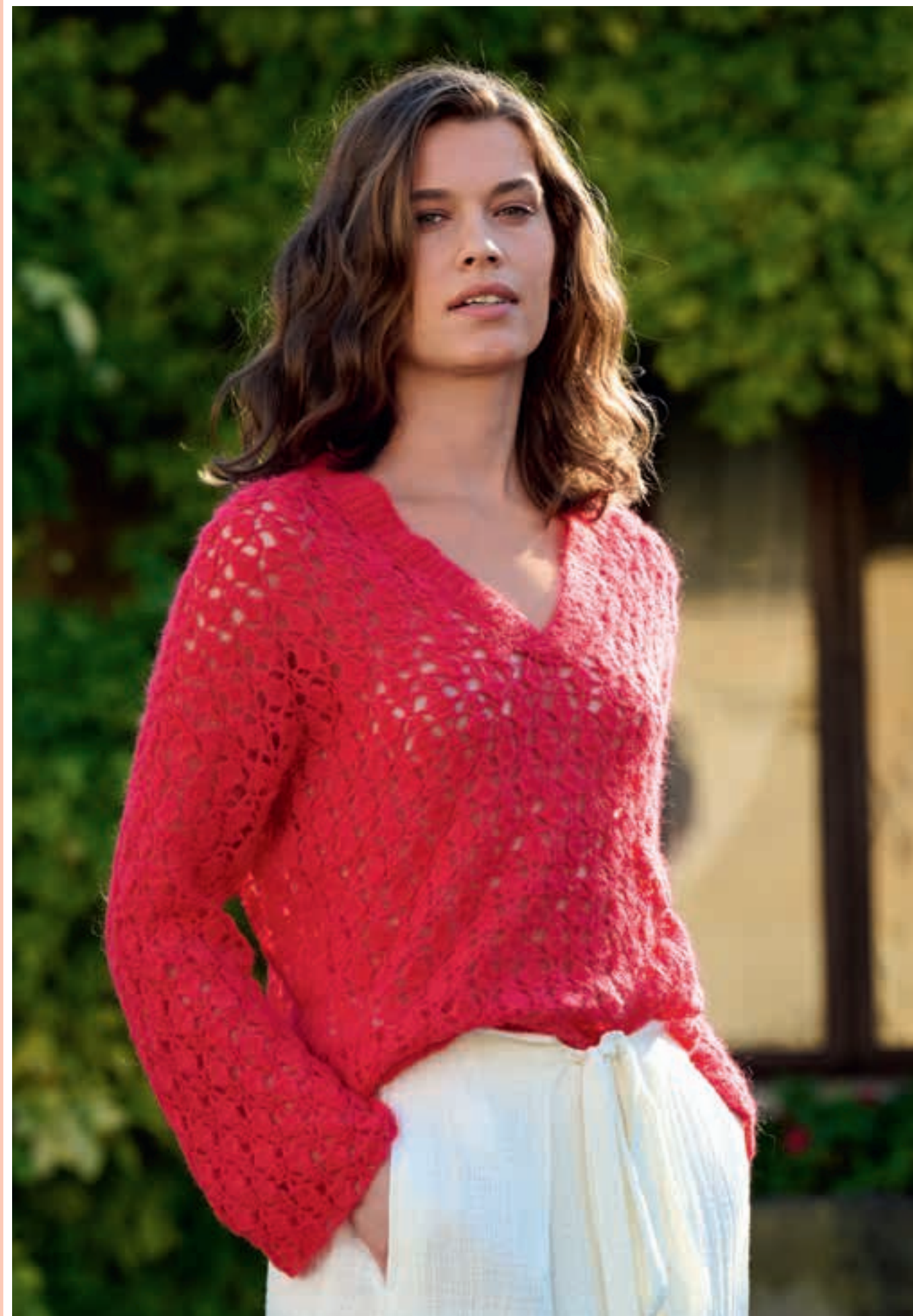
Modell 33: Seidiges Flauschgarn wurde hier im Rautenmuster verhäkelt. Der Ausschnitt des PULLOVERS besteht aus einem einfachen, breiten Schlitz und der dazu passenden Blende. SETASURI