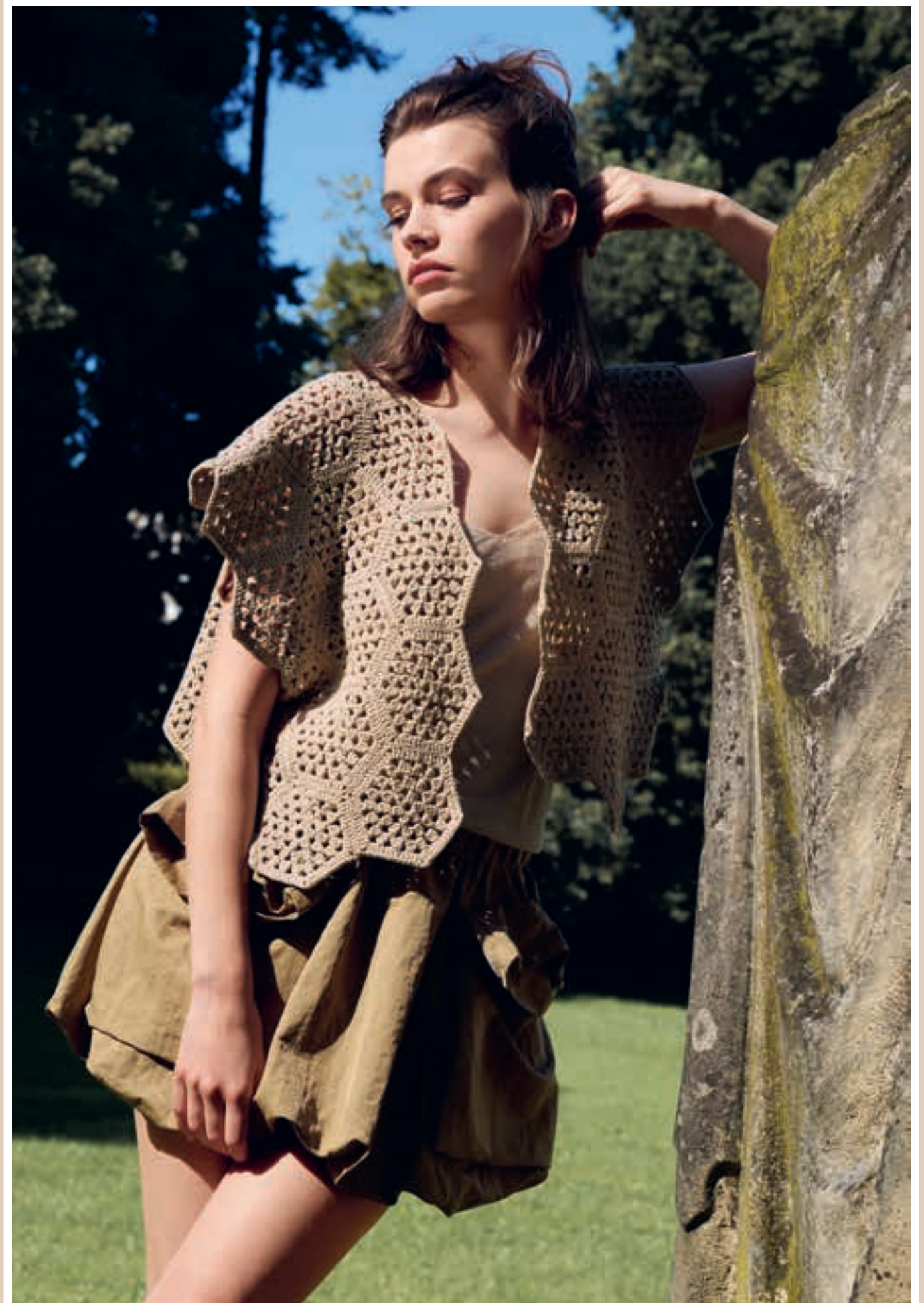
Modell 23: Einfarbig, in Boxy-Form und mit grafisch anmutenden Grannys wirkt diese HÄKELWESTE überraschend cool und skulptural. PROMESSA