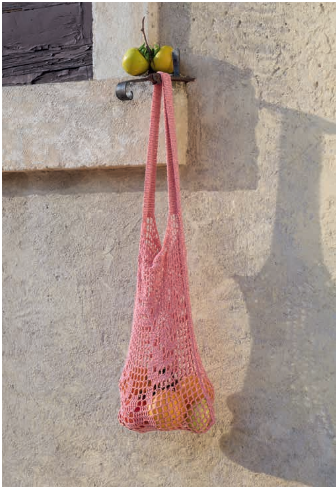
Modell 31: Passt perfekt zum Top von Seite 48/49: das gehäkelte Einkaufsnetz im floralen Filetmuster. FILO PAILLETES