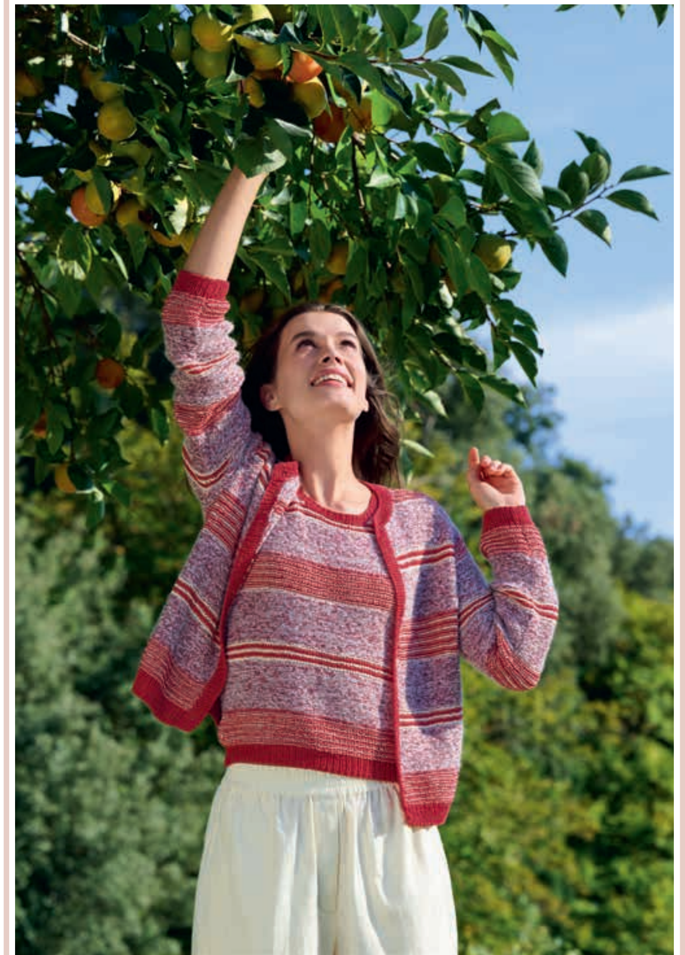
Modell 27 & 28: Streifen aus vier verschiedenen Qualitäten bringen Struktur und Glanz in das klassische TWIN-SET. Gestrickt wird überwiegend kraus rechts. SUMMER CASHMERE, FILO LUREX, SETASURI & GLAMOUR