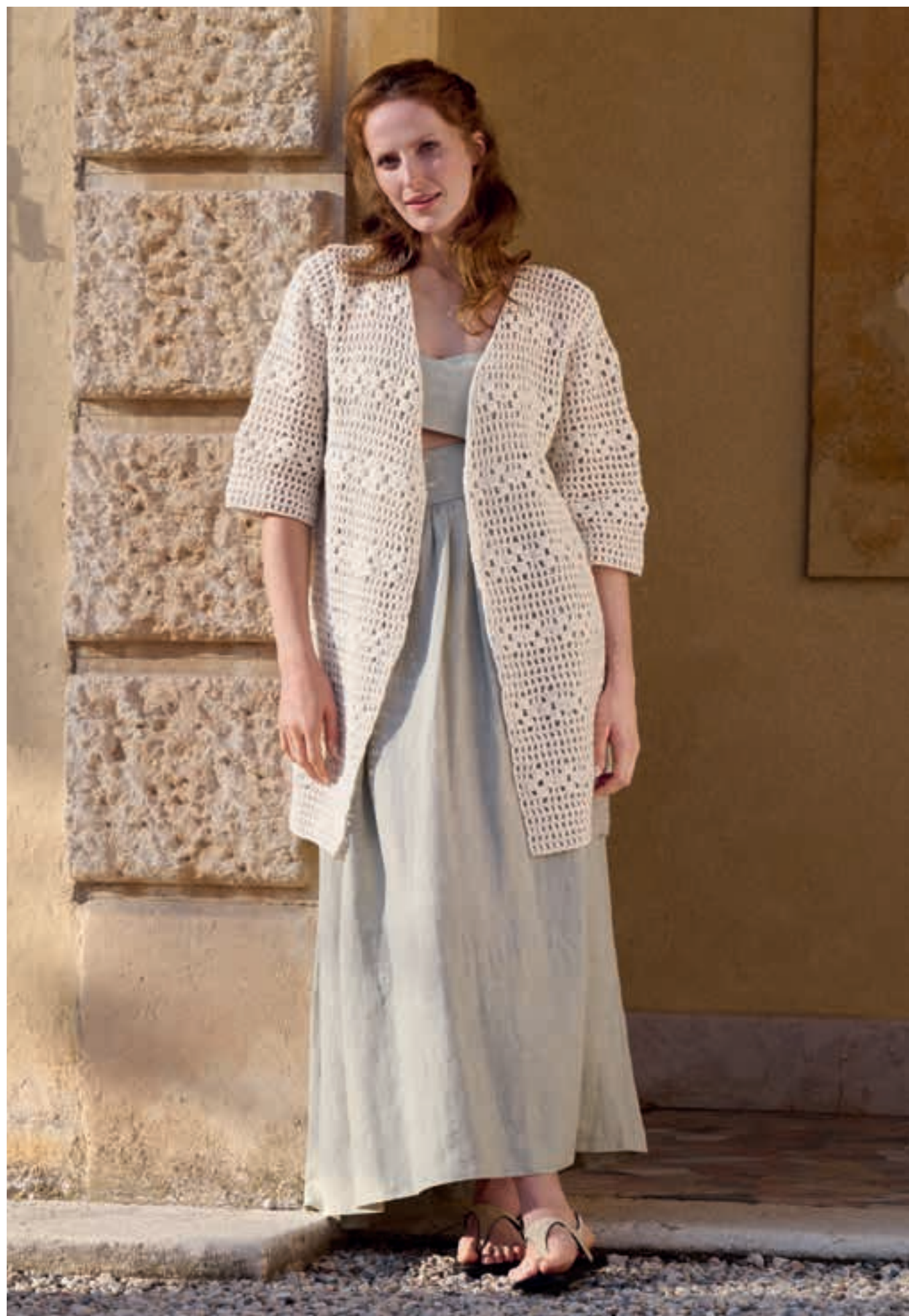
Modell 16: Unser verschlussloser Häkel-CARDIGAN schmeichelt mit einer langen, lockeren Silhouette und weichem Schlauchgarn in Kalkweiß. SUMMER SOFTNESS