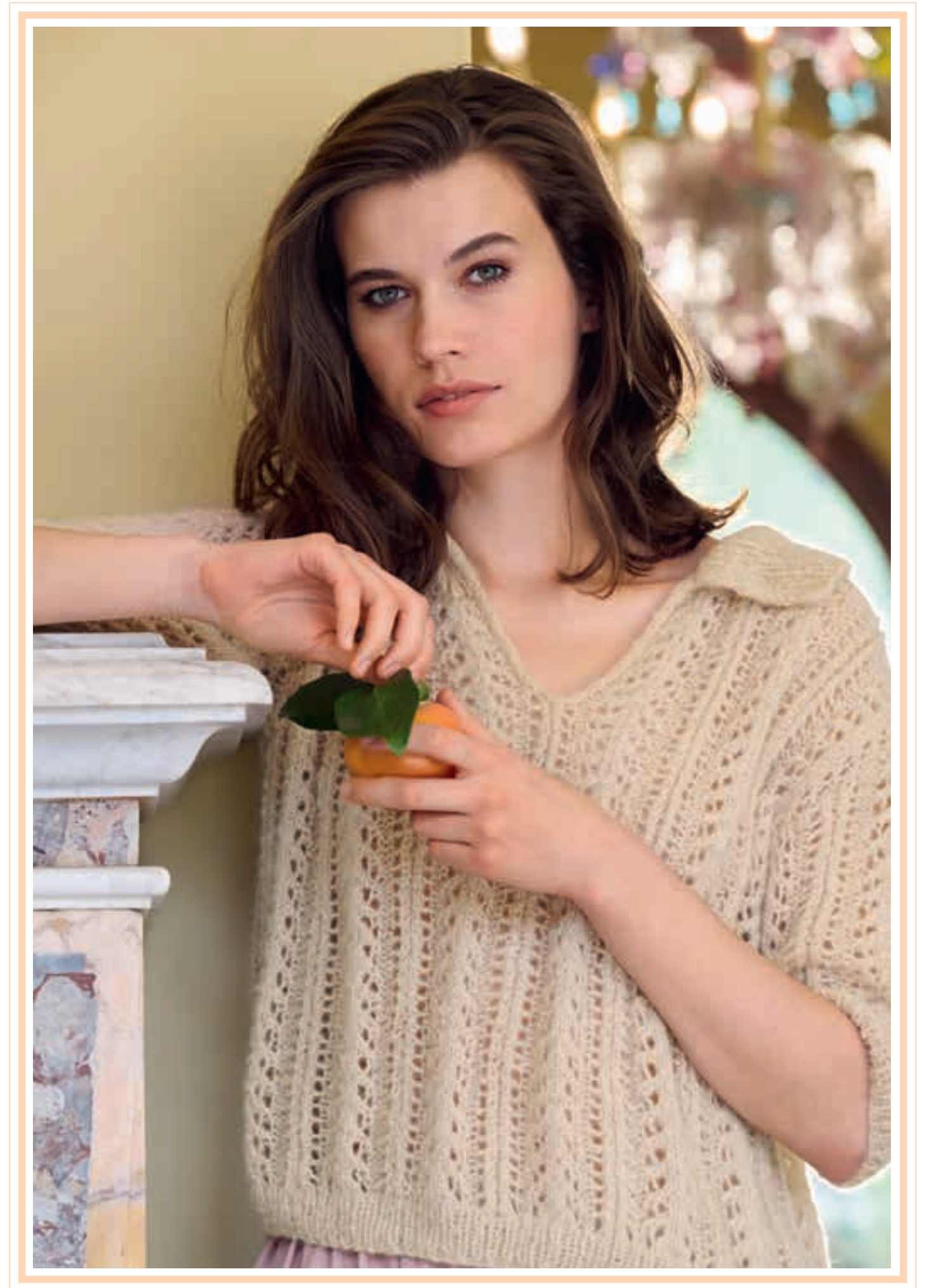
Modell 15: Miniperlen, Ajour-Strukturen und ein sportlicher Polokragen – ein perfekter Mix aus entspannt und chic. Unkompliziert: Der Ausschnitt des SHIRTS besteht aus einem einfachen Schlitz. SETASURI PEARLS