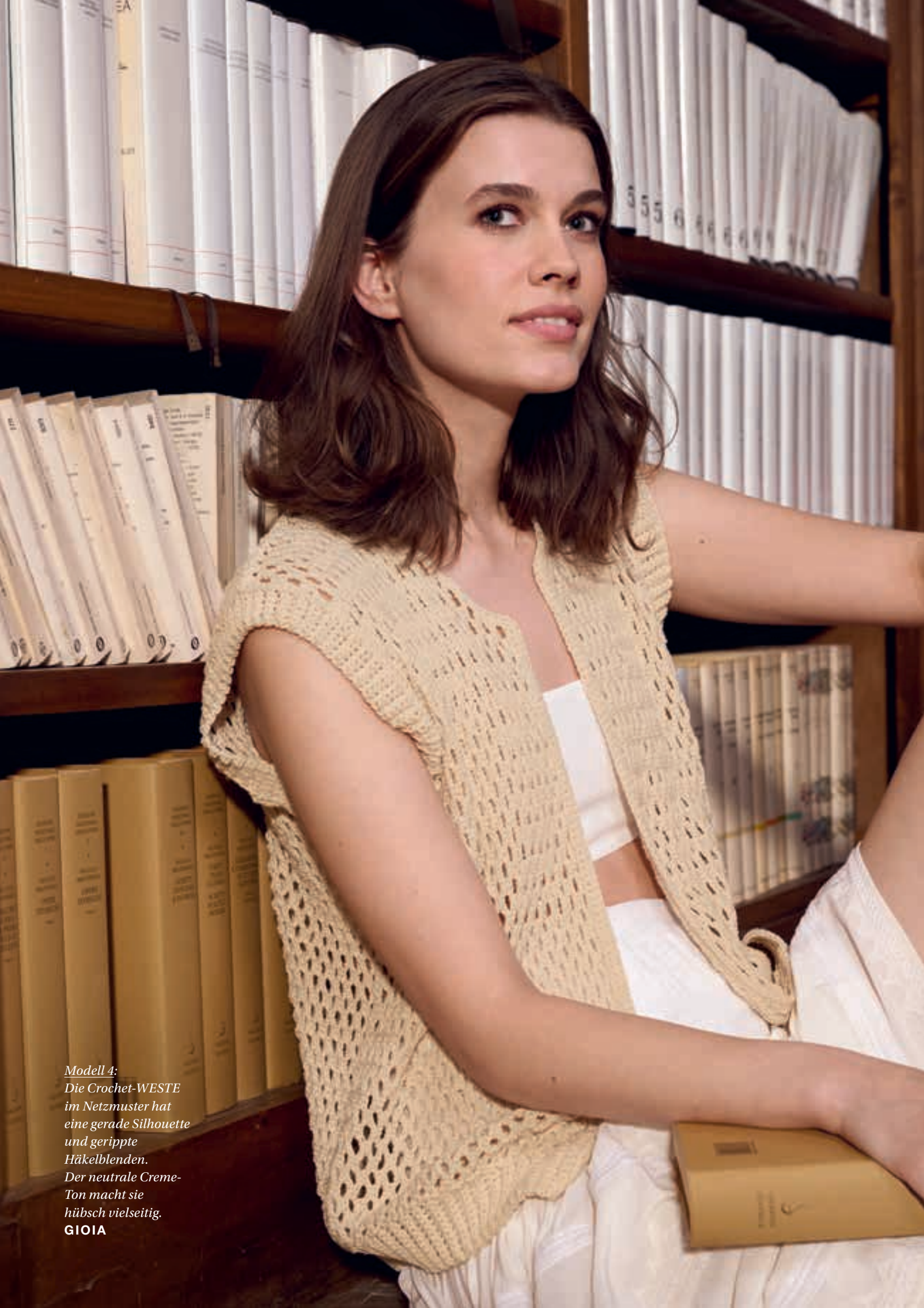
Modell 4: Die Crochet-WESTE im Netzmuster hat eine gerade Silhouette und gerippte Häkelblenden. Der neutrale Creme- Ton macht sie hübsch vielseitig. GIOIA