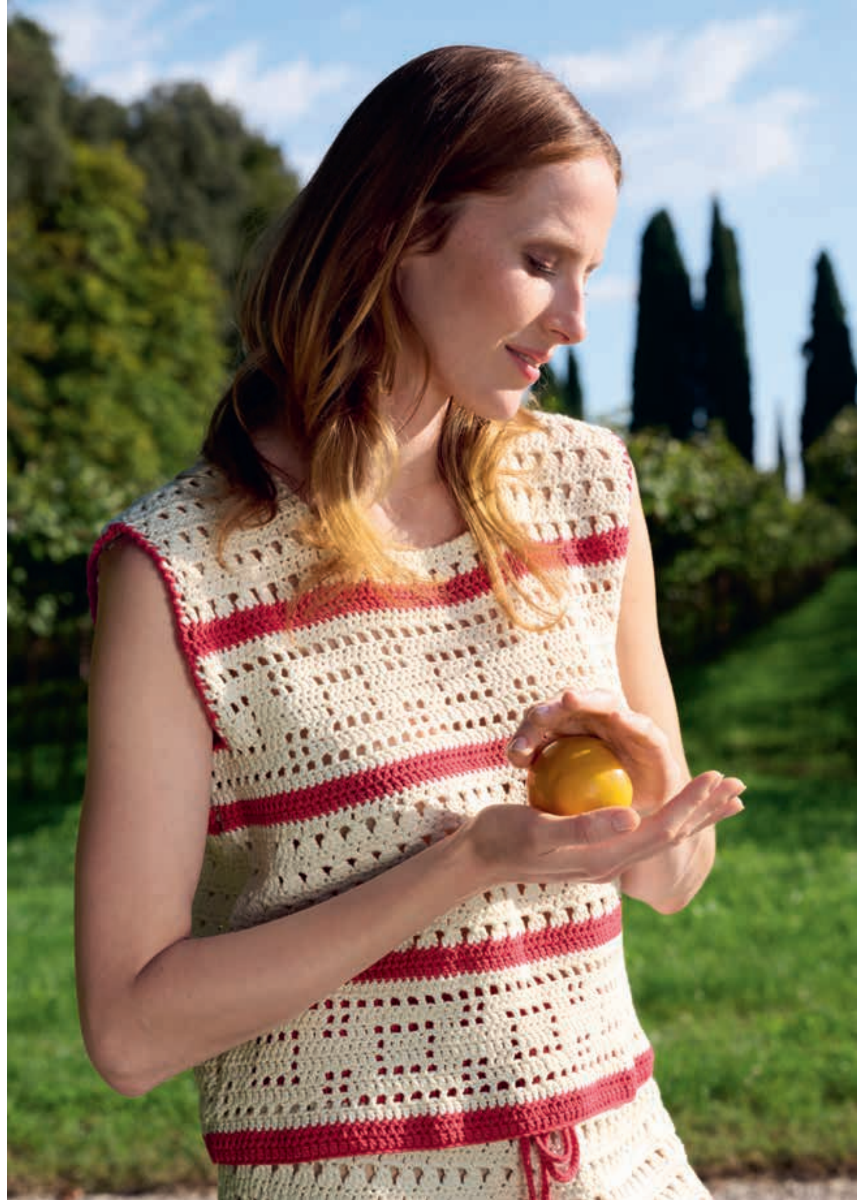
Modell 25 & 26: Streifen und ein luftiges Kästchenmuster bringen Abwechslung in das gehäkelte ENSEMBLE. Damit der Rock nicht von den Hüften rutscht, wird sein Rippenbund ausnahmsweise gestrickt. PROMESSA