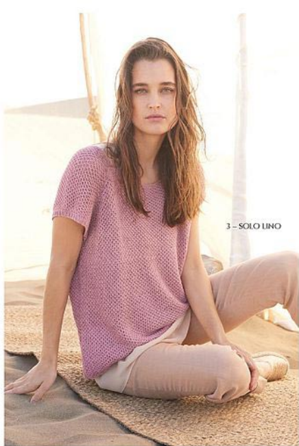
3 - SOLO LINO