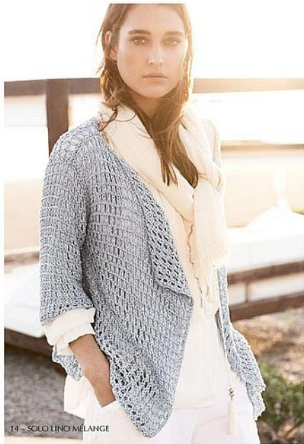
14 - SOLO LINO MÉLANGE