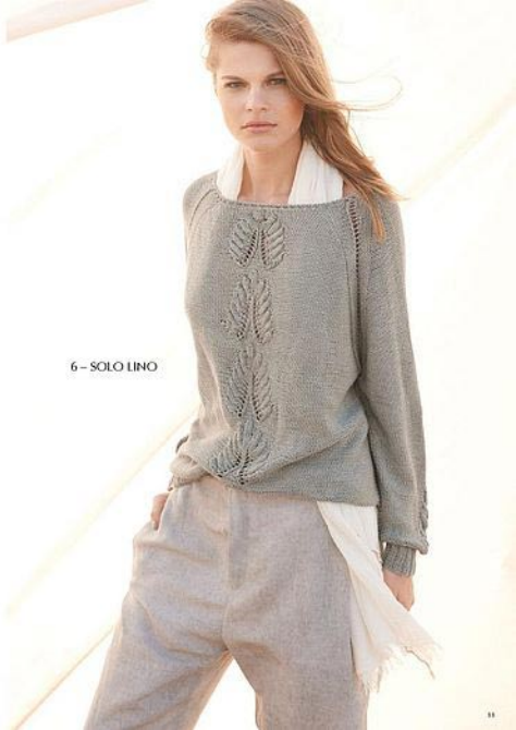
6 - SOLO LINO