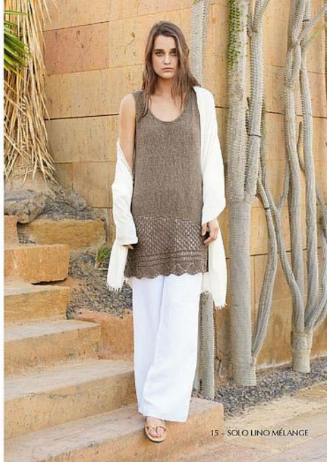
15 - SOLO LINO MÉLANGE