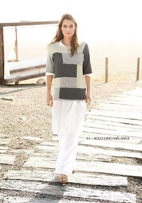
11 - SOLO LINO MÉLANGE