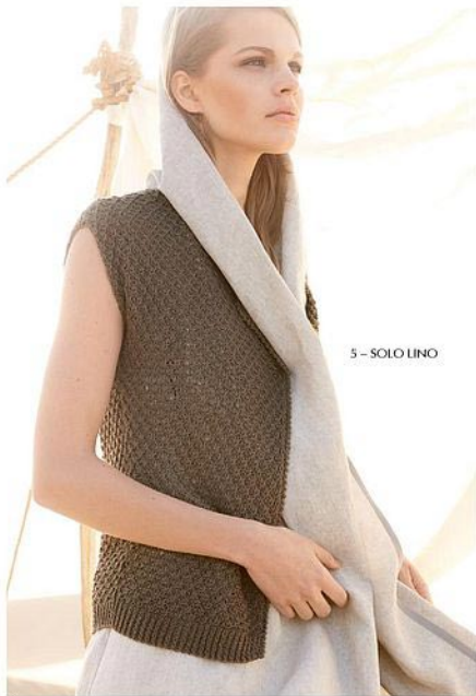
5 - SOLO LINO