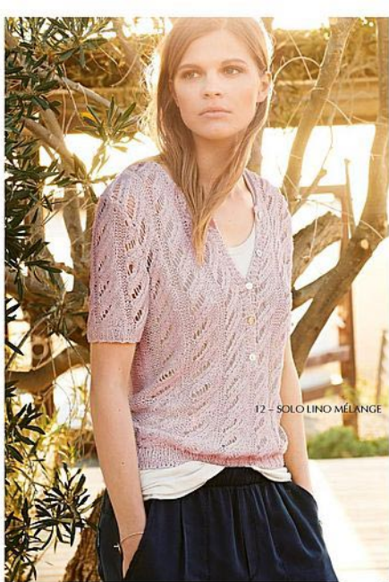
12 - SOLO LINO MÉLANGE