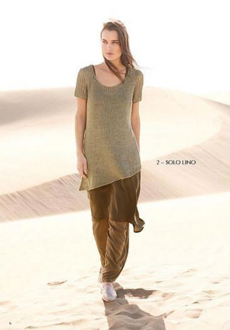
2 - SOLO LINO