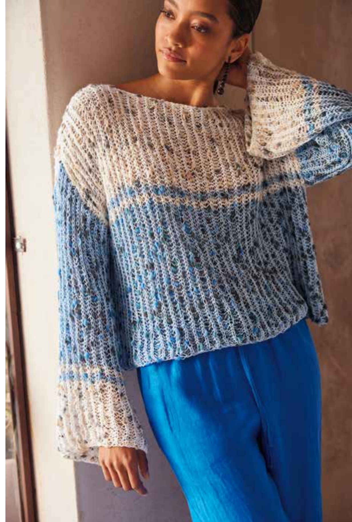
46 - Principianti (klingt irgendwie cooler als „Anfänger“) aufgepasst! Die frechen Noppen und das plastische Patentmuster spielen eindeutig die Hauptrolle bei diesem entspannt lockeren PULLOVER. Angesetzte Ärmel und der gerade U-Boot-Ausschnitt kommen ohne Zu- und Abnahmen aus. - P O P C O R N