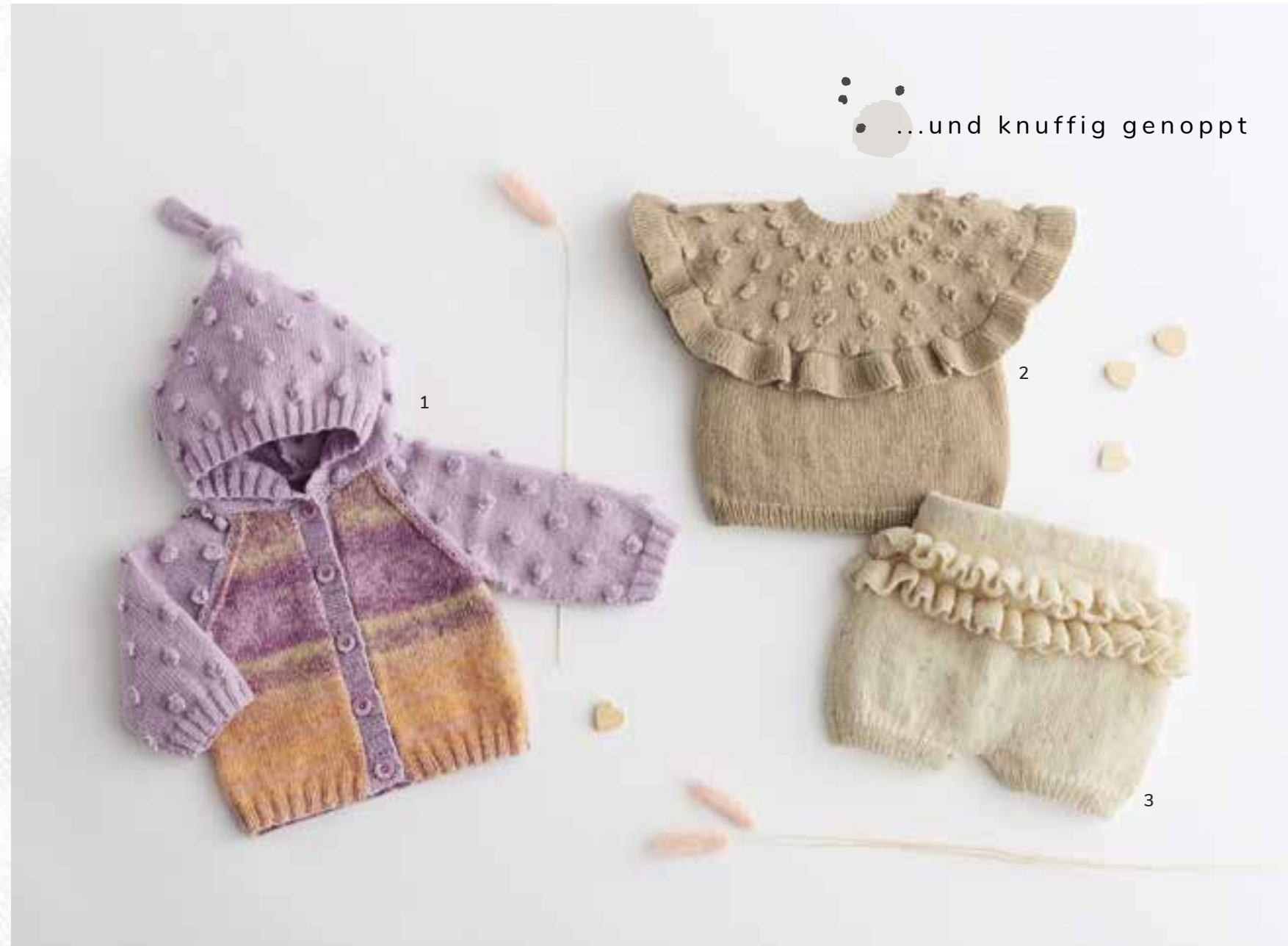
1 - Jacke. Cool Wool Baby & Cool Wool Baby Dégradé • 2 - Pulli. Cool Wool Baby 3 - Hose. Cool Wool Baby Print Punto