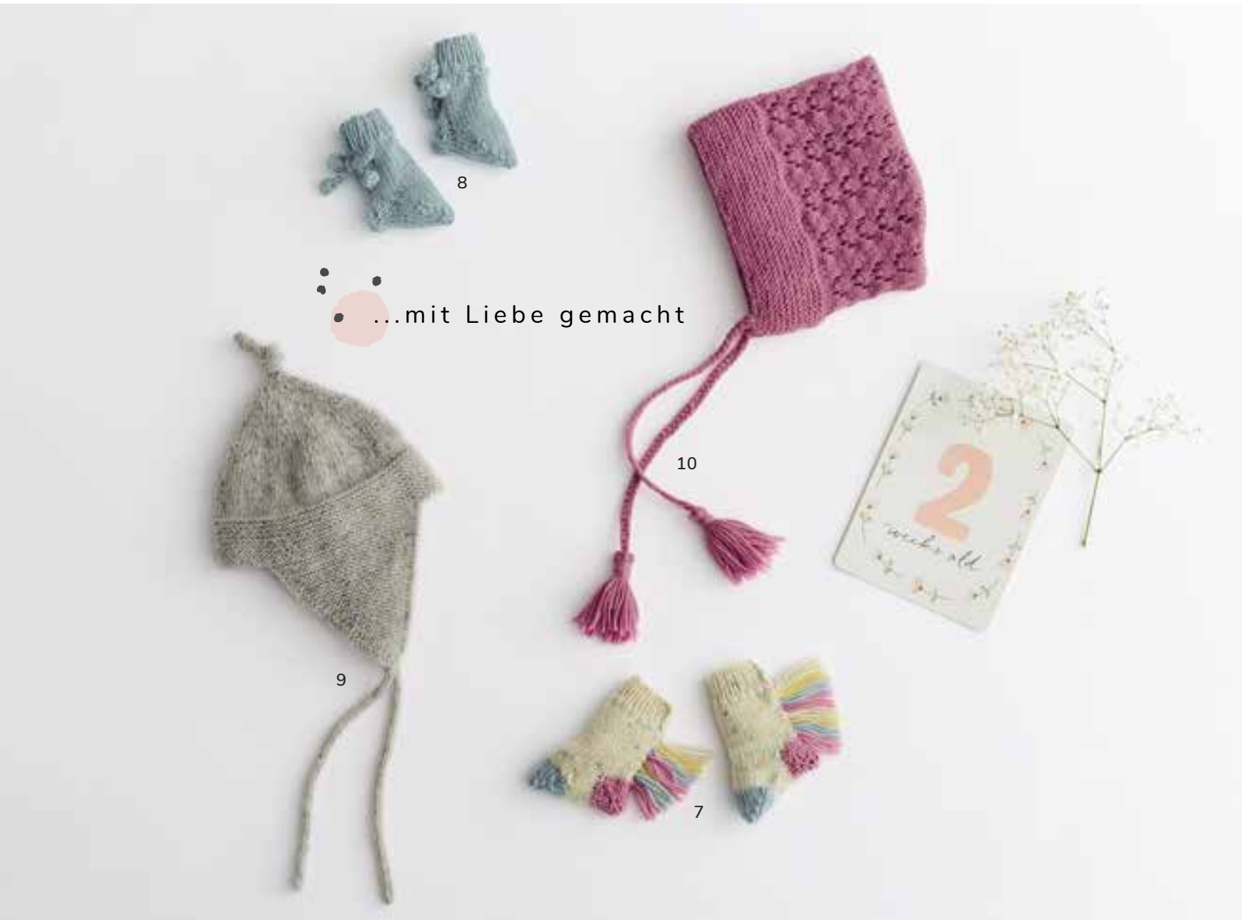
7 - Strümpfe. Cool Wool Baby Print Punto & Cool Wool Baby • 8 - Strümpfe. Cool Wool Baby 9 - Mütze. Cool Wool Baby Printo Punto • 10 - Mütze. Cool Wool Baby