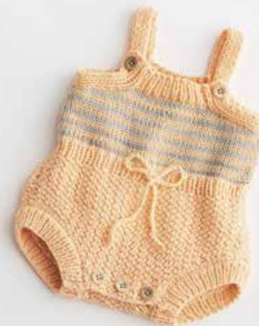
4 - Strampler. Soft Cotton • 5 - Jacke. Soft Cotton Dégradé