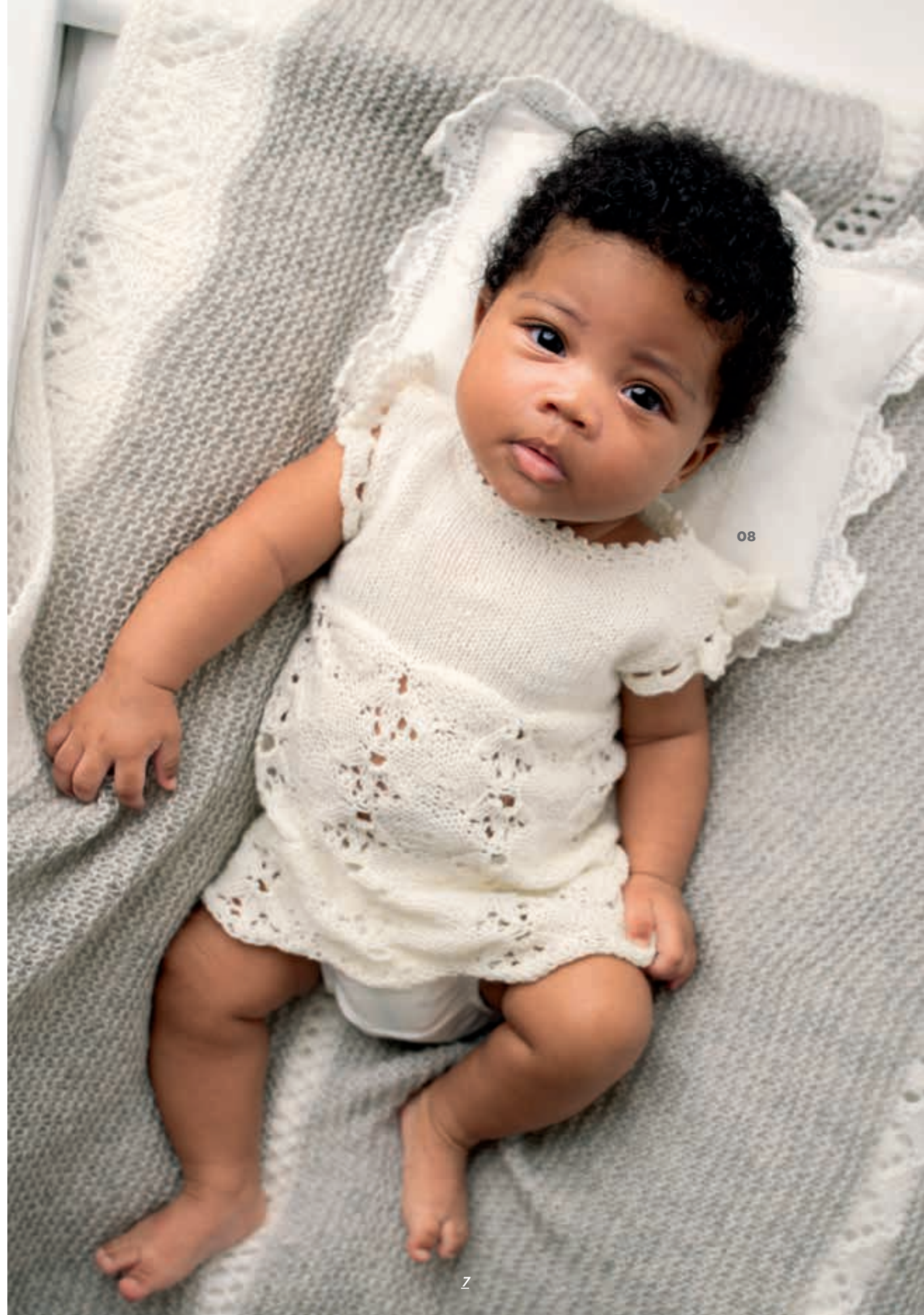
MODEL 07 Muts ECOPUNO . MODEL 08 Jurkje COOL WOOL BABY .