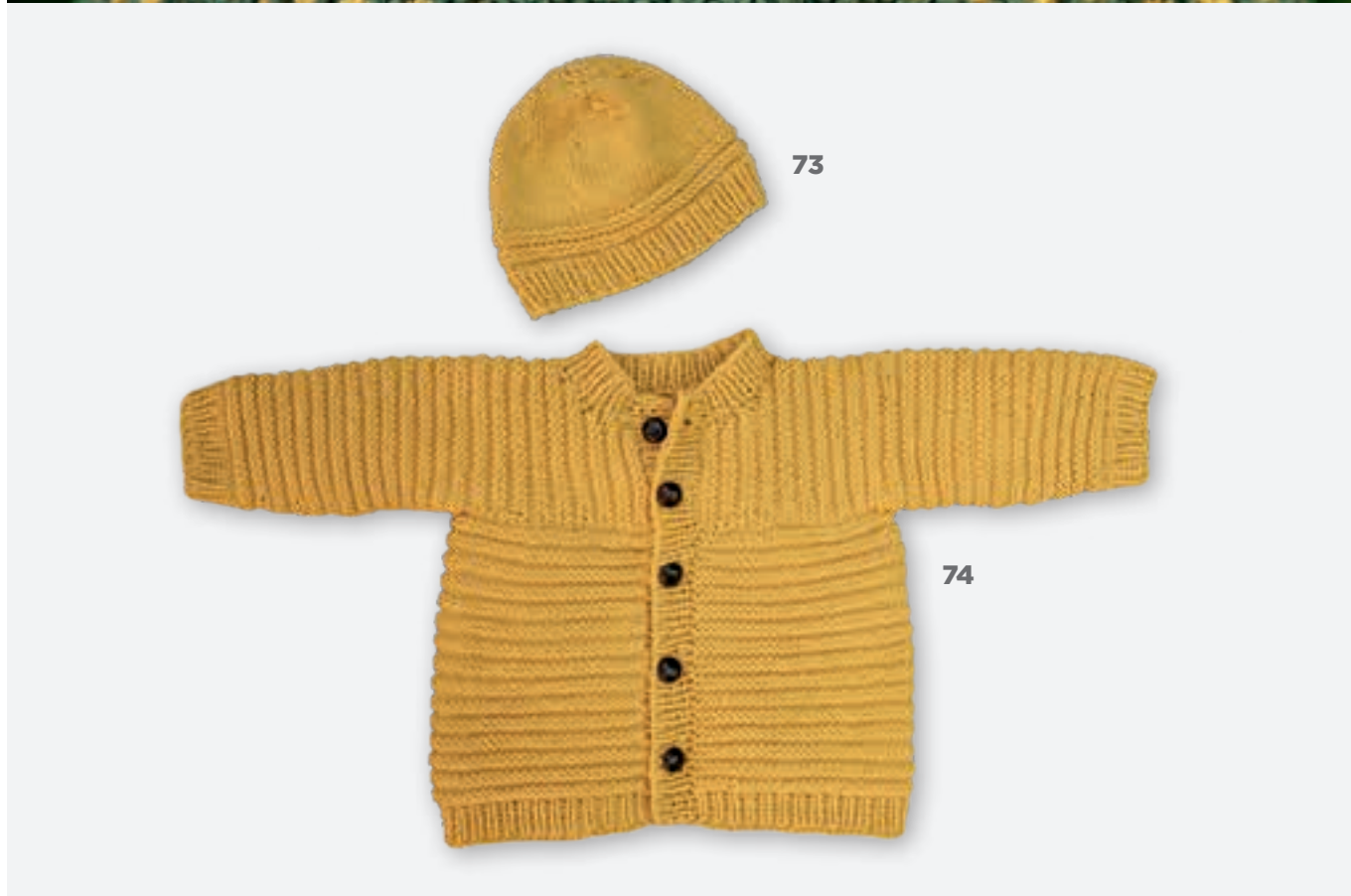
MODEL 71 & 72 Muts & vestje FOURSEASON . MODEL 73 & 74 Muts & vestje FOURSEASON .