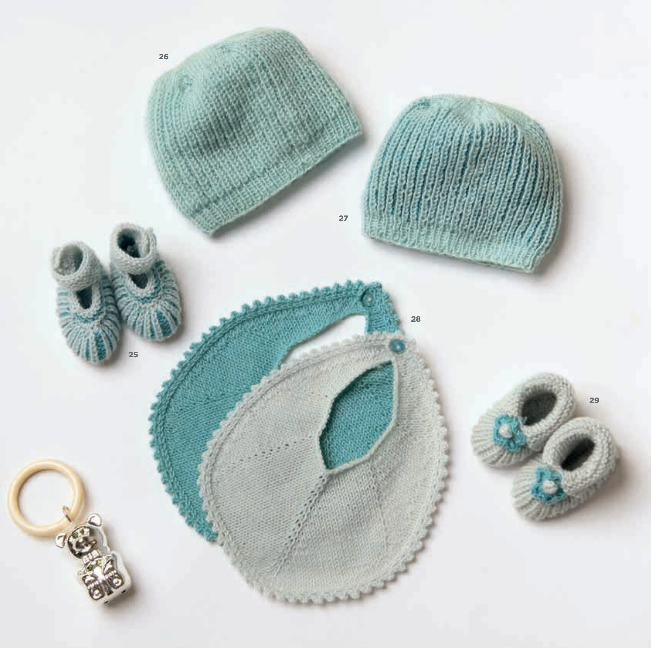
MODEL 25 Schoentjes COOL WOOL BABY . MODEL 26 Muts COOL WOOL BABY . MODEL 27 Muts COOL WOOL BABY . MODEL 28 Slabbetje COOL WOOL BABY . MODEL 29 Schoentjes COOL WOOL BABY .