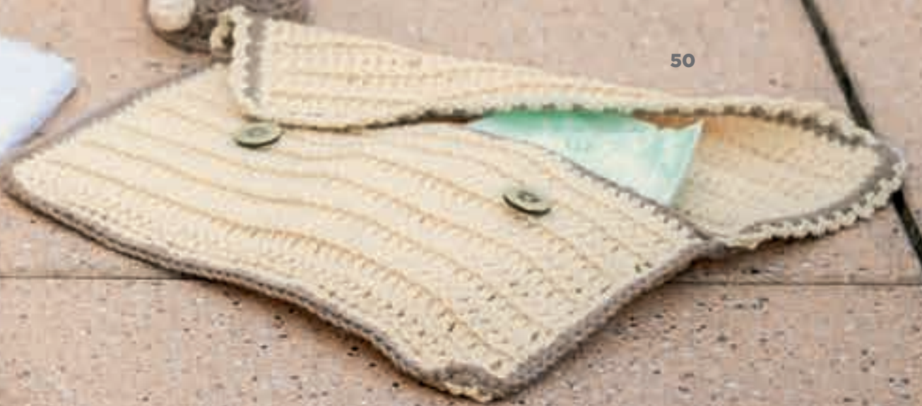
MODEL 43 Badmantel BABY SOFT . MODEL 44 Meeuw STAR & COTONE . MODEL 45-48 Gastenhanddoek STAR . MODEL 49 Buidel STAR . MODEL 50 Tasje STAR .