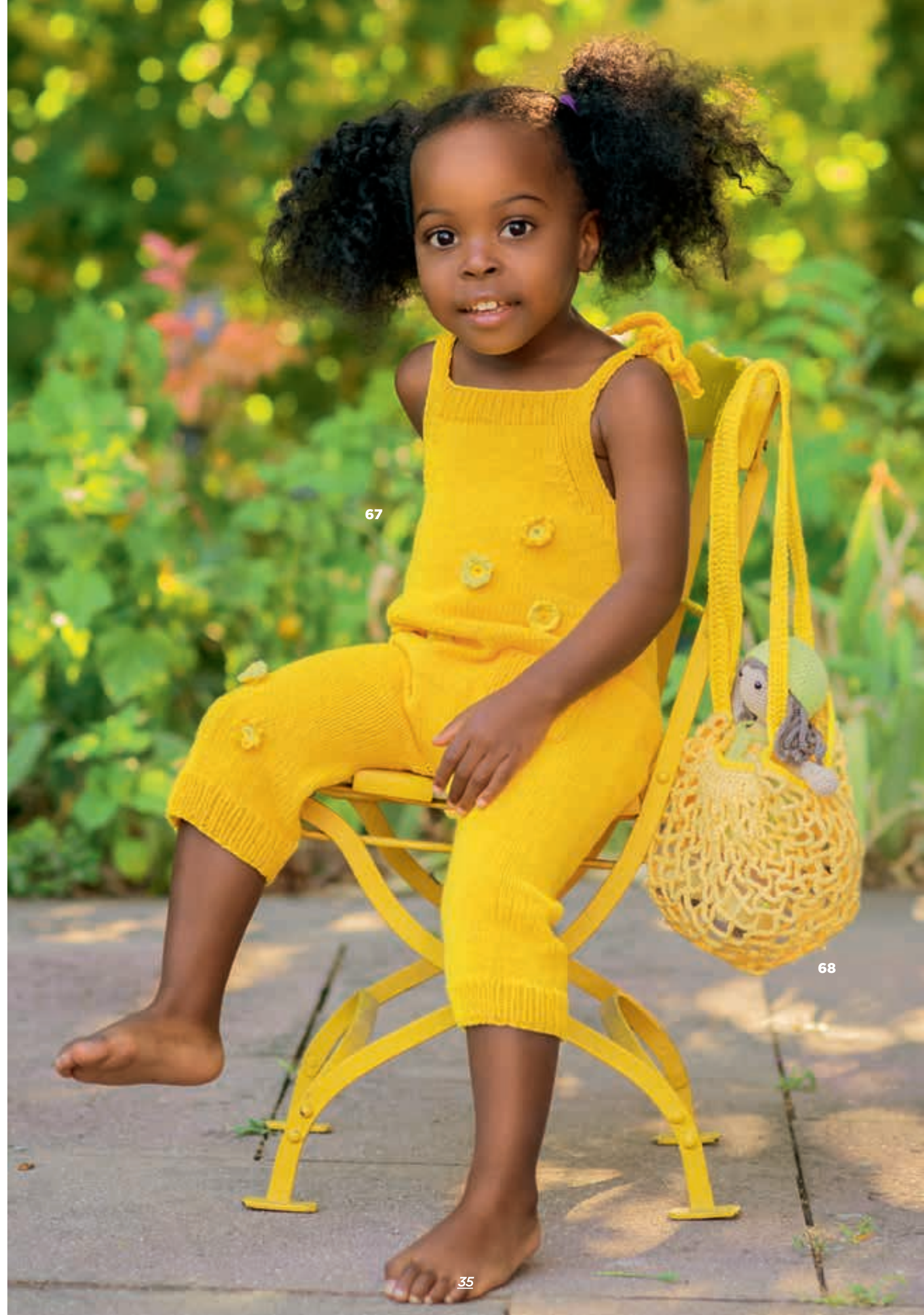
MODEL 66 Trui SOFT COTTON. MODEL 67 Overall ELASTICO. MODEL 68 Buidel ELASTICO.