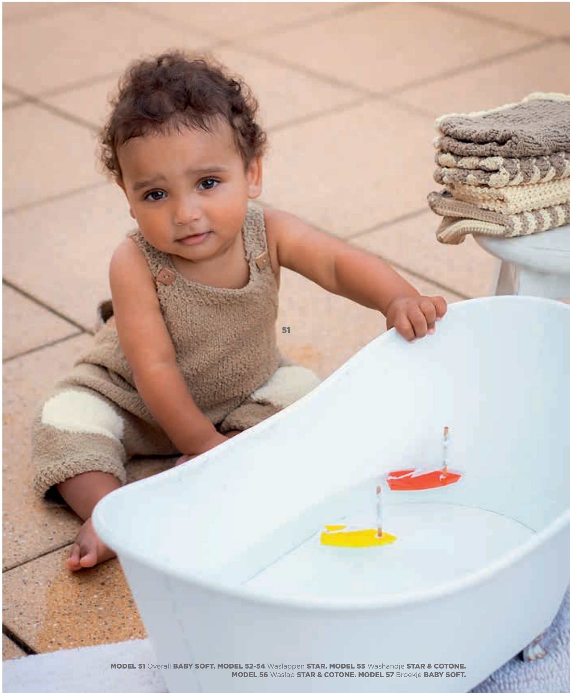
MODEL 51 Overall BABY SOFT . MODEL 52-54 Waslappen STAR . MODEL 55 Washandje STAR & COTONE . MODEL 56 Waslap STAR & COTONE . MODEL 57 Broekje BABY SOFT .