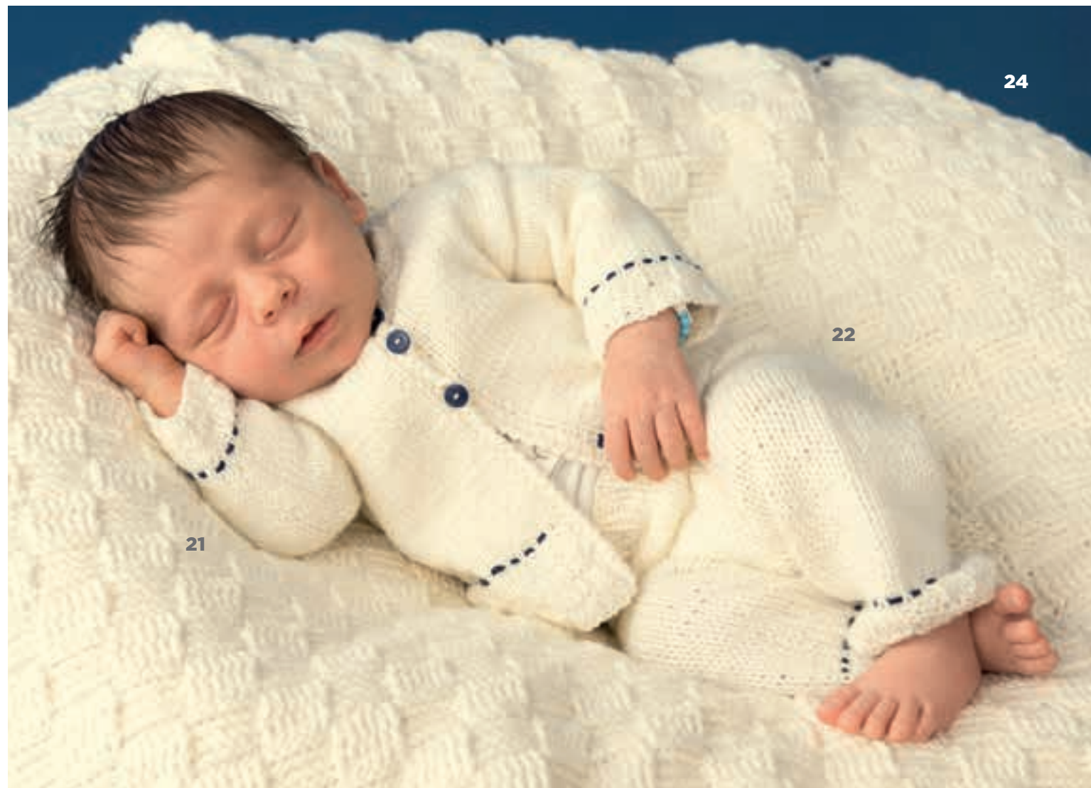
MODEL 21 & 22 Vestje & broekje SOFT COTTON . MODEL 23 Muts SOFT COTTON . MODEL 24 Plaid SOFTCOTTON .

Soms zijn het die kleine accenten, zoals het fijne zwarte borduurwerk en de contrasterende knoopjes, die zo'n simpel gebreid vestje juist die extra touch verlenen.