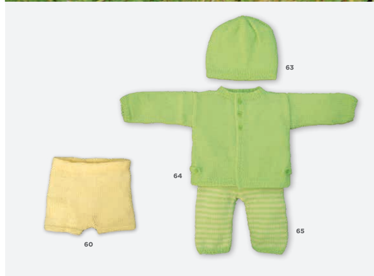
MODEL 58 Hoofdband COOL WOOL BABY. MODEL 59 & 60 Jurkje & broekje COOL WOOL BABY. MODEL 61 & 62 Poppetjes COOL WOOL BABY. MODEL 63-65 Muts, vestje & broekje COOL WOOL BABY.