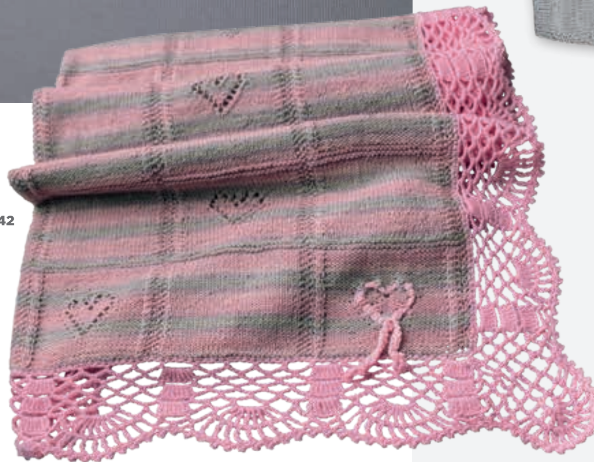
MODEL 38 Muts COOL WOOL BABY . MODEL 39 Body COOL WOOL BABY . MODEL 40 & 41 Vestje & broekje COOL WOOL BABY . MODEL 42 Plaid COOL WOOL BABY & COOL WOOL BABY DÉGRADÉ .