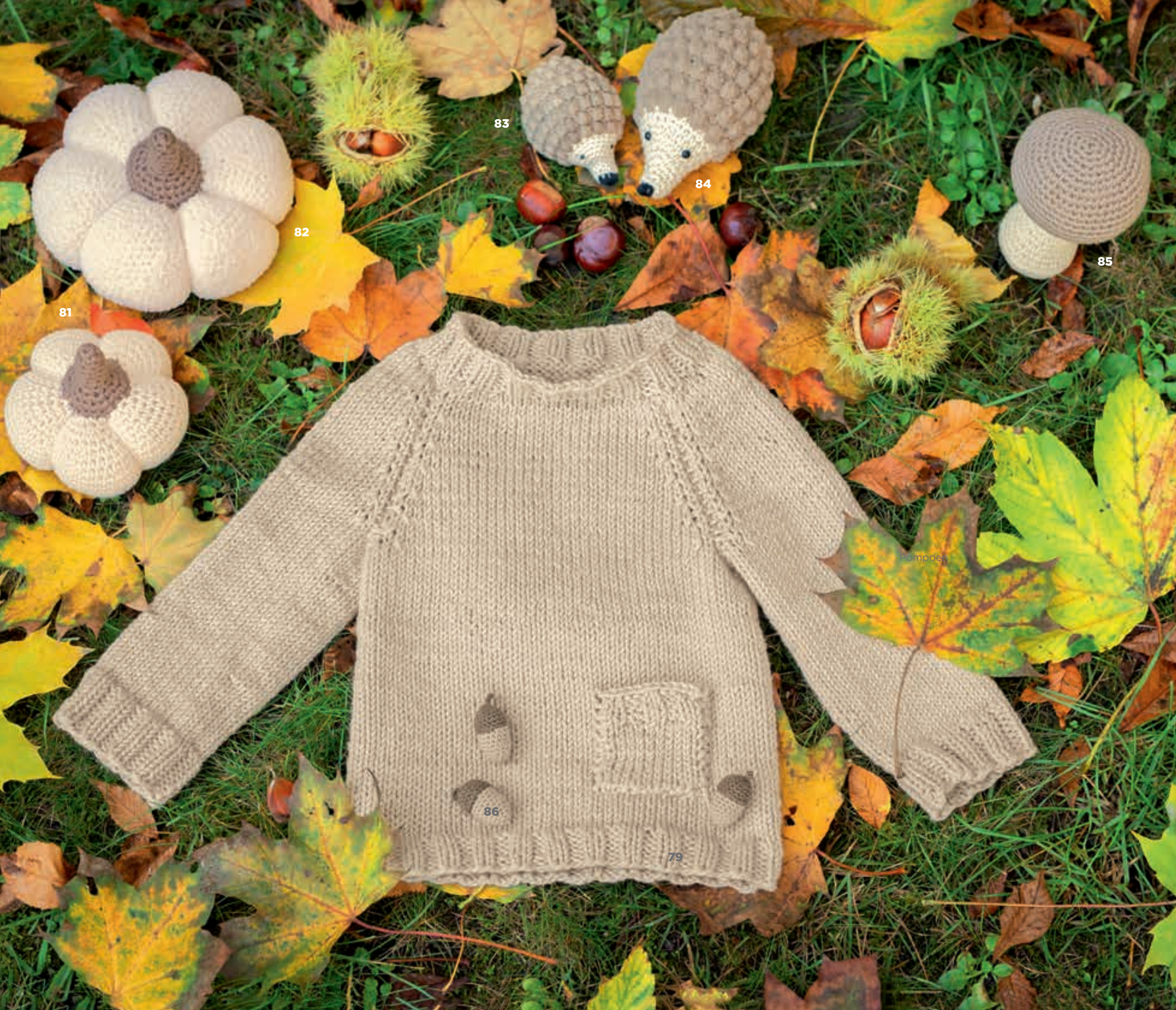
MODEL 81 Pompoen STAR . MODEL 82 Pompoen BABY SOFT & STAR . MODEL 83 Egel COTONE . MODEL 84 Egel BABY SOFT & COTONE . MODEL 85 Paddenstoel STAR . MODEL 86 Eikels COOL WOOL BABY .