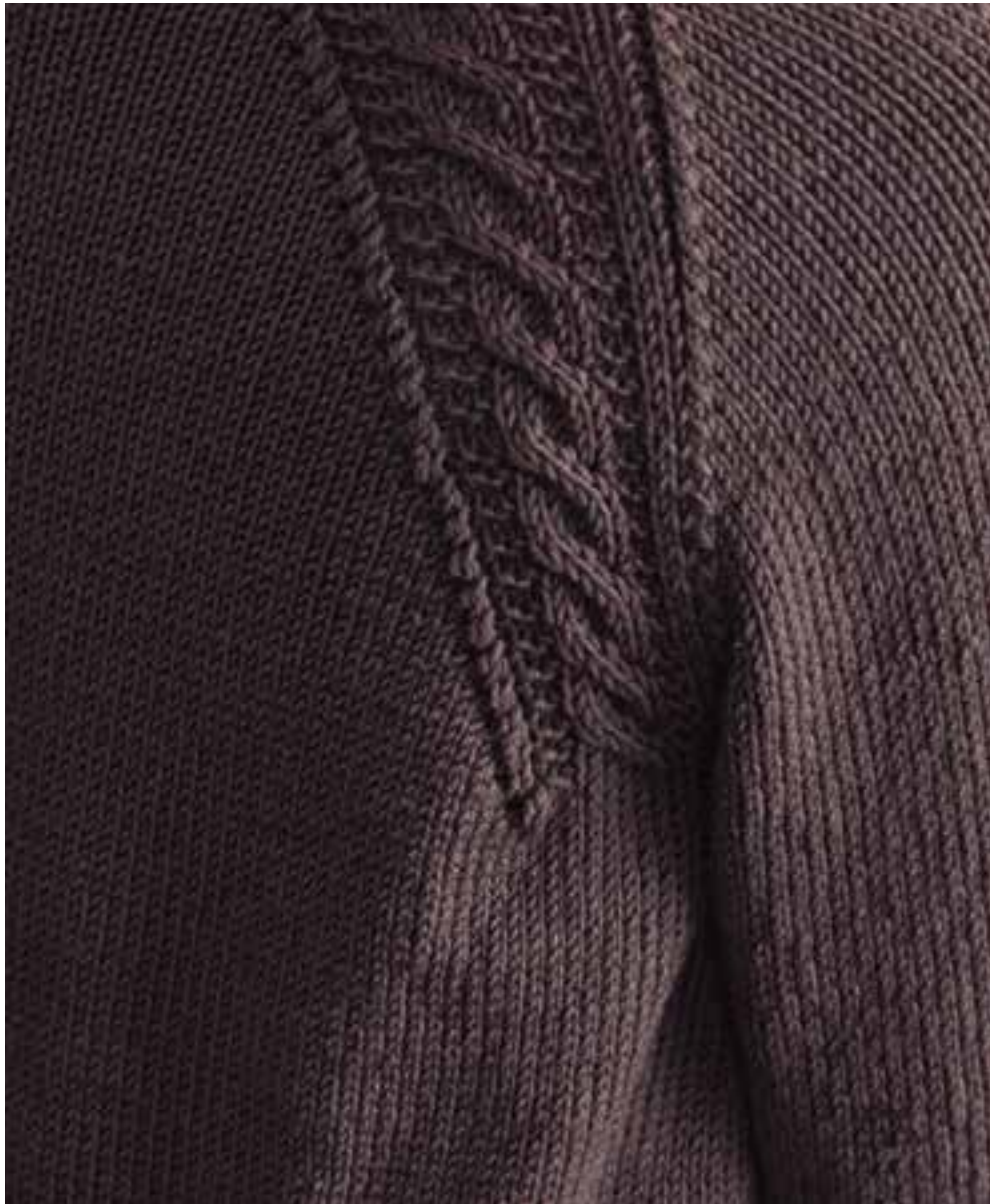
model 22 Cool Wool Big kleur 964