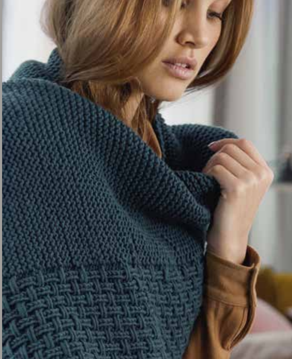
model 15 Bingo kleur 197