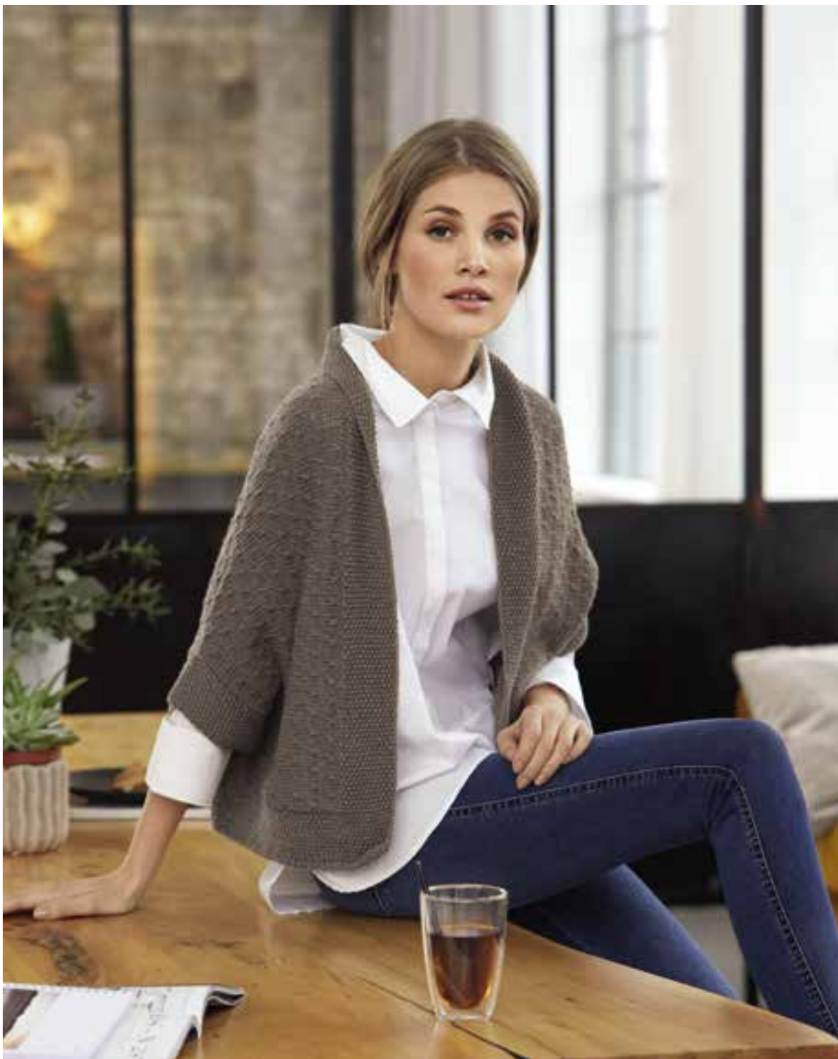
model 14 Cool Wool Big kleur 686