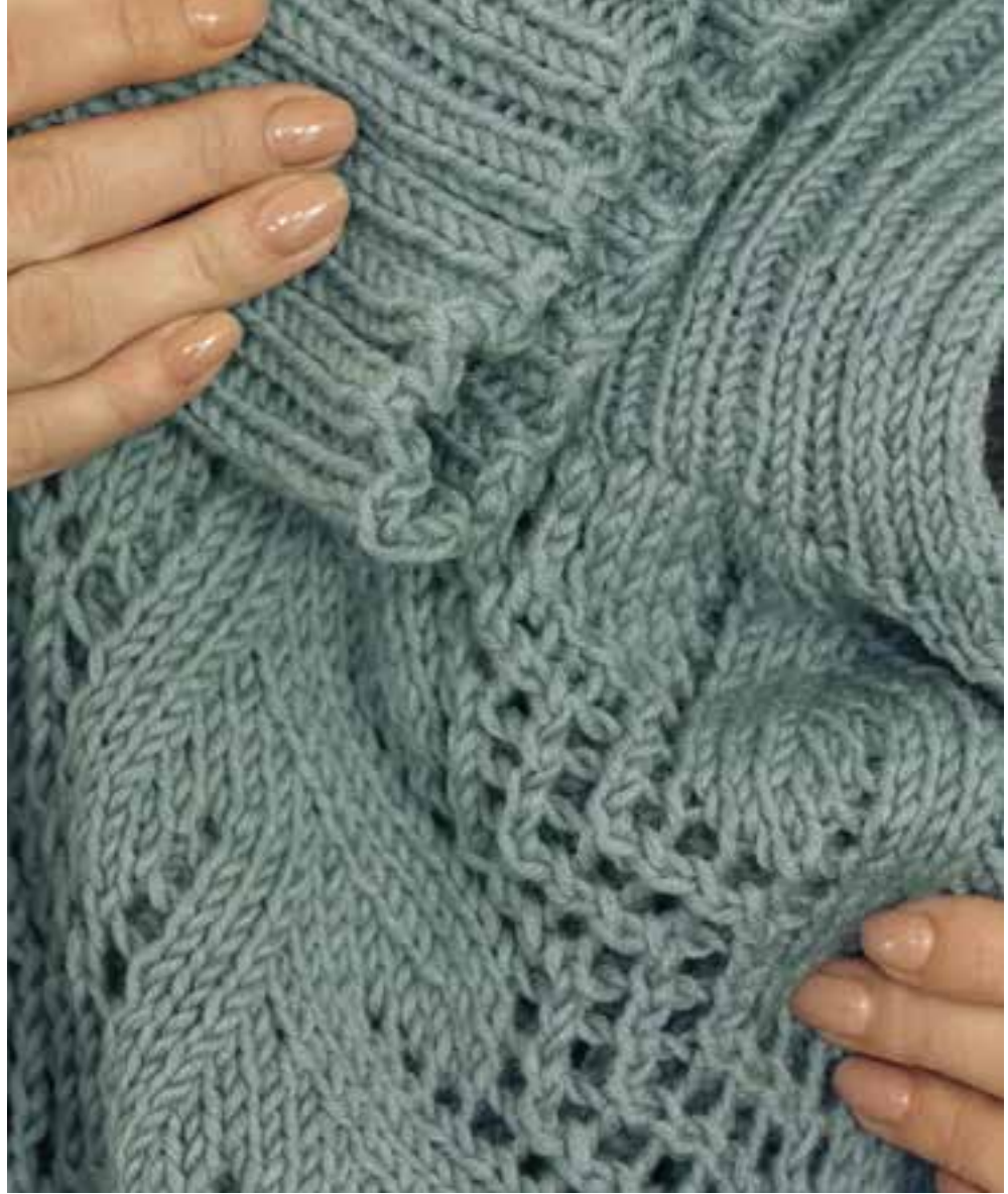
model 12 Bingo Mélange kleur 237