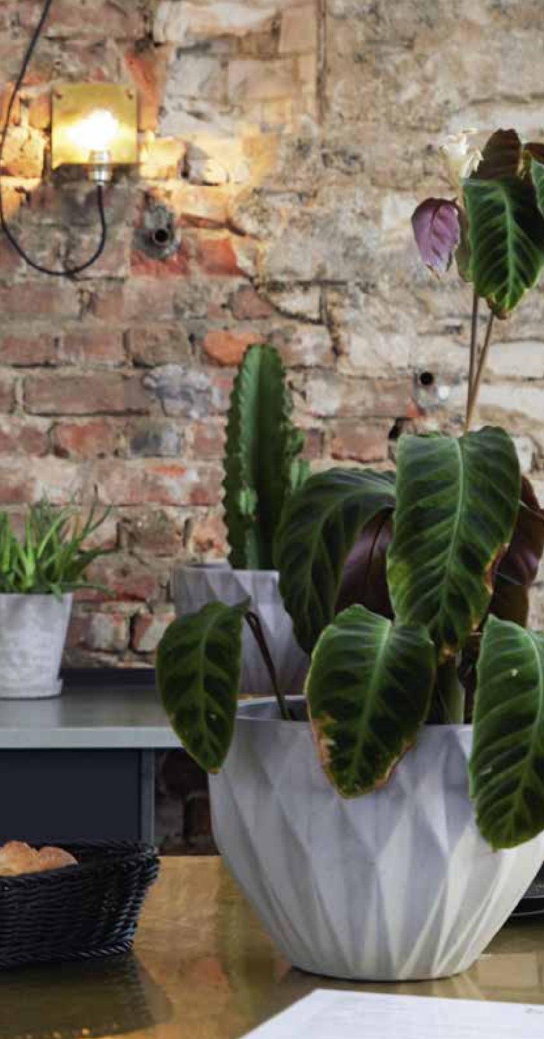
model 05 Cool Wool Big kleur 947