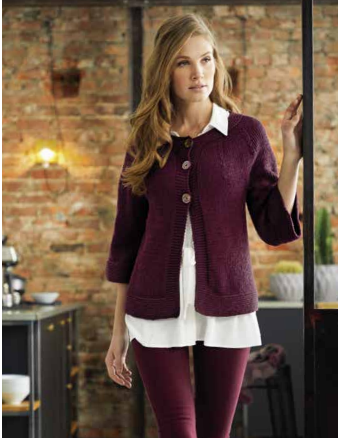
model 24 Bingo kleur 184