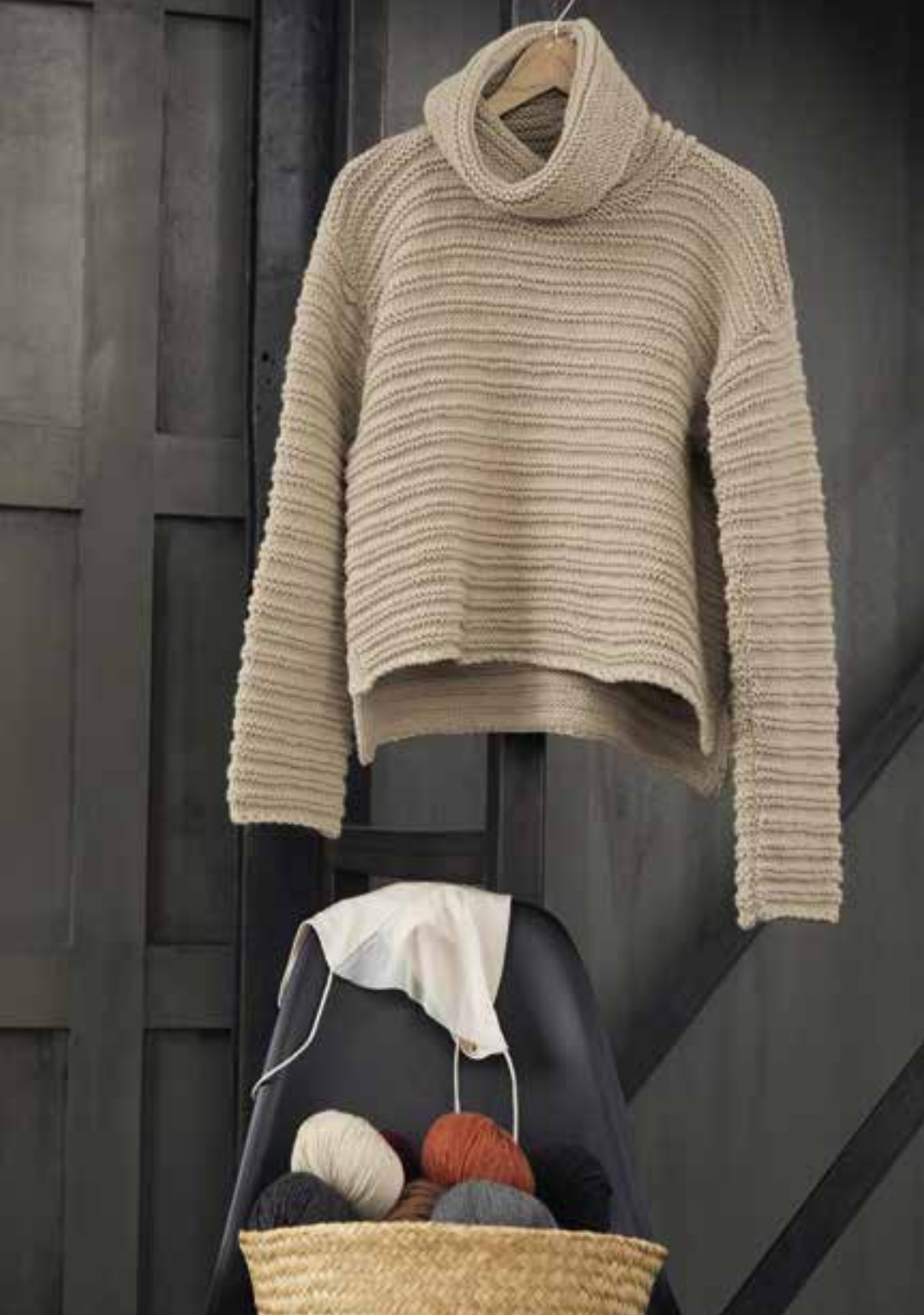
model 06 Bingo Mélange kleur 249