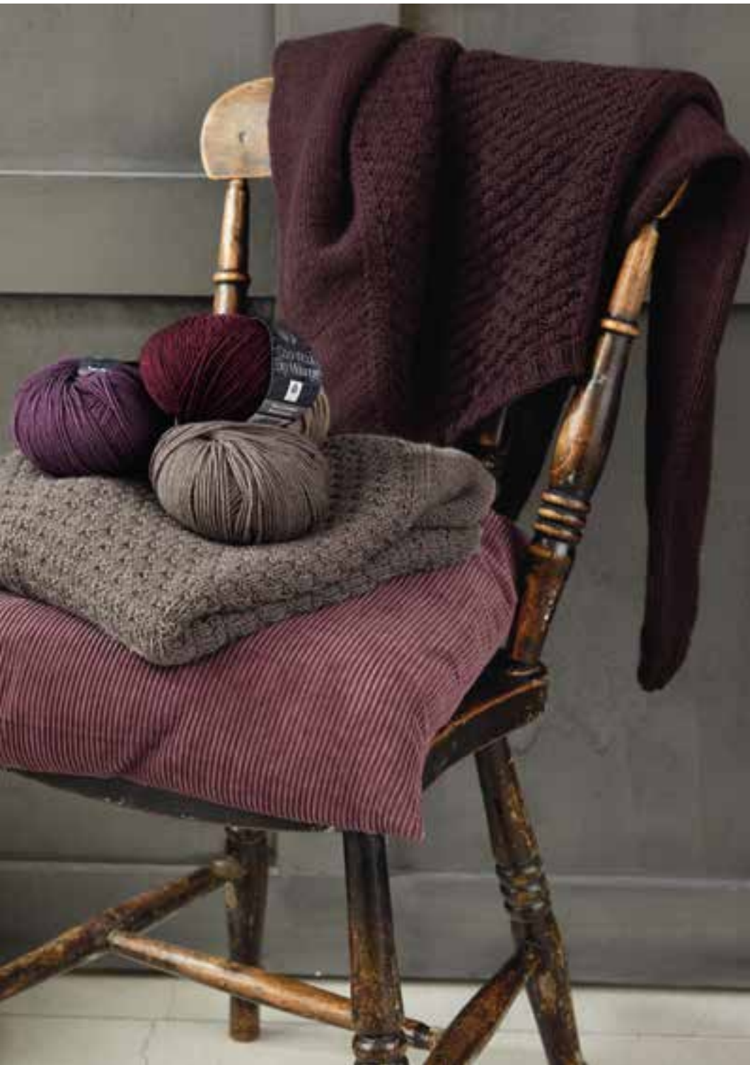
zij: model 25, Cool Wool, kleur 2047 hij: model 26, Cool Wool Mélange, kleur 115