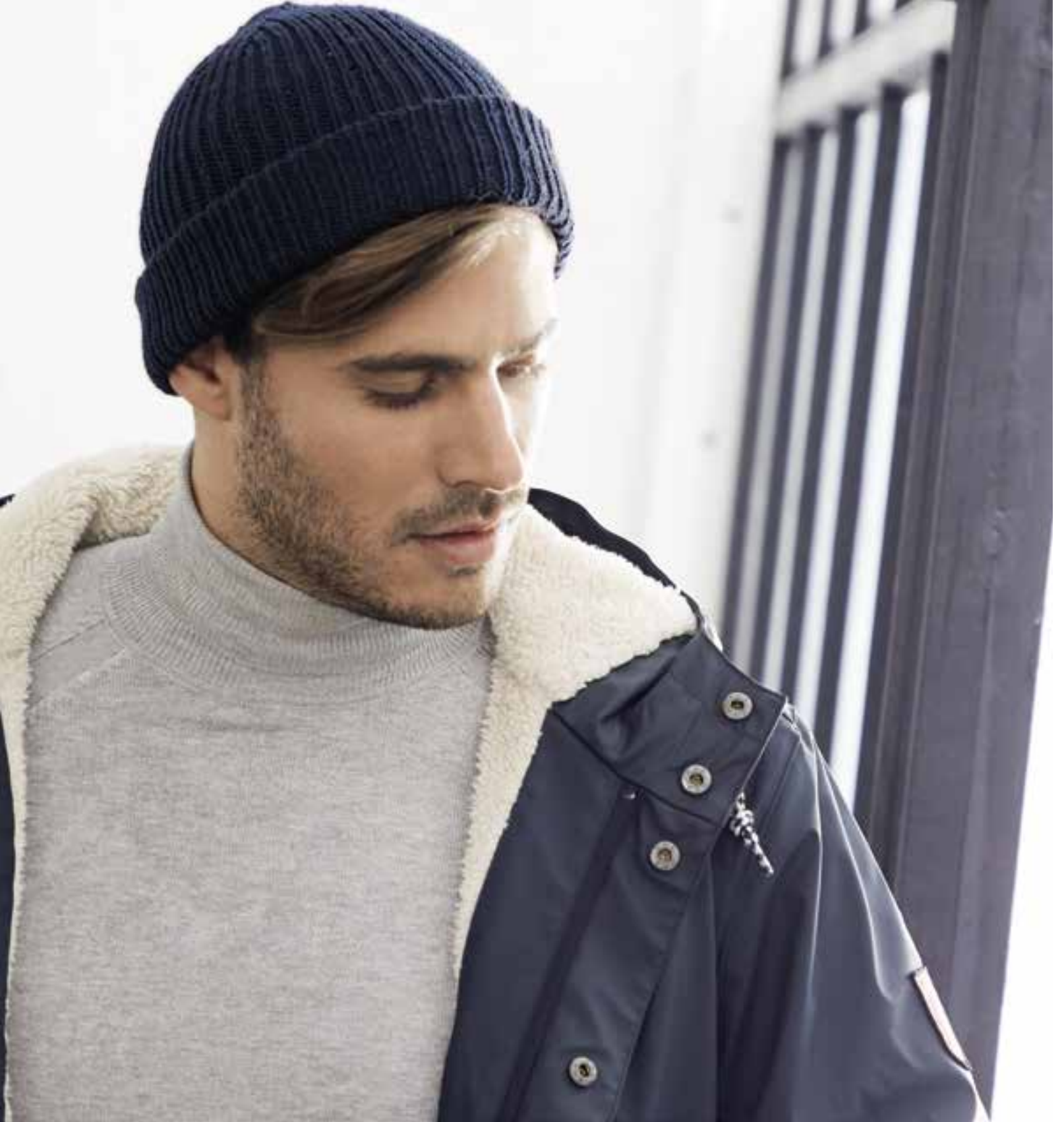
model 45 Cool Wool kleur 414