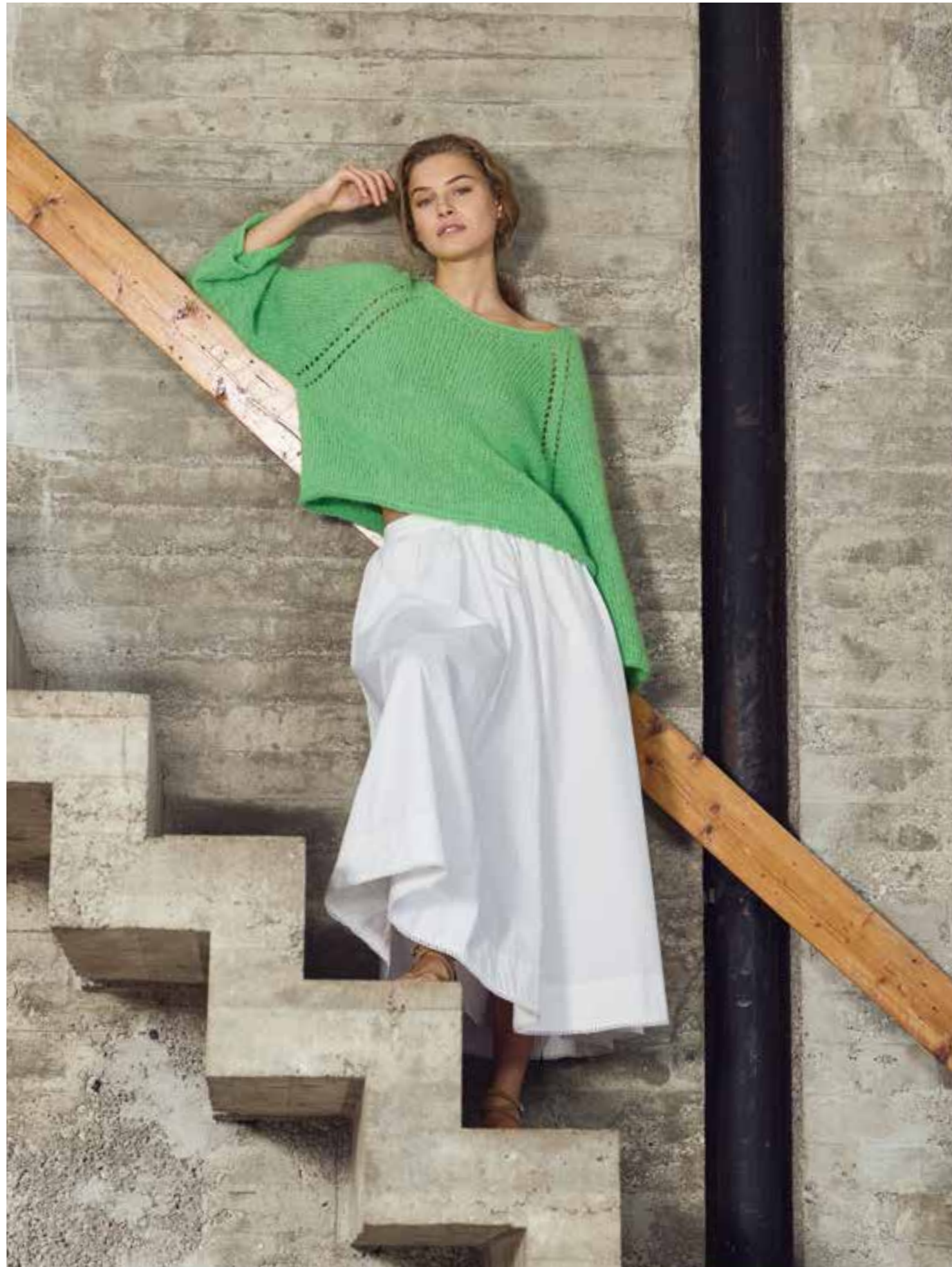
27 – SETASURI | rechte Seite: 28 – SOMMER SOFTNESS