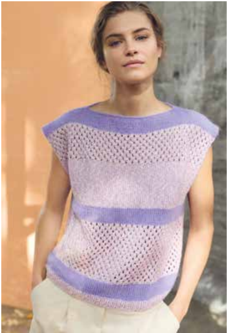
linke Seite: 23 – PER FORTUNA 24 – BOTTONI + SETASURI