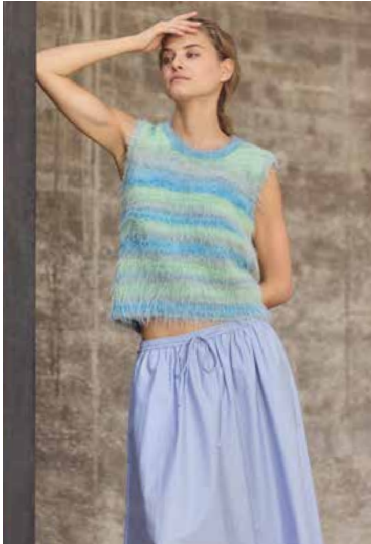
TOP (11) von Seite 16/17 | 12 – BASTA MISTA