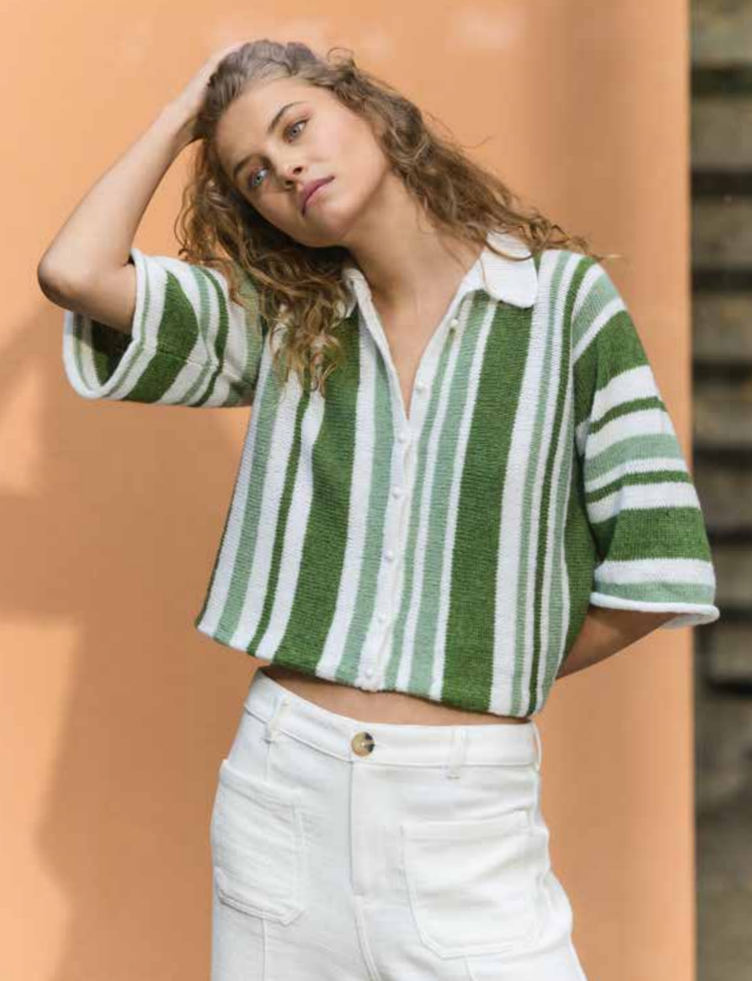
20 – ECOPUNO