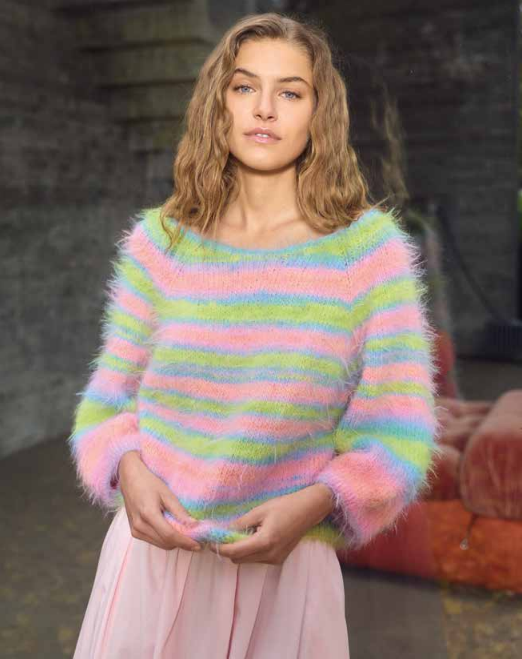
linke Seite: 13 – BASTA MISTA JACKE (12) von Seite 18/19