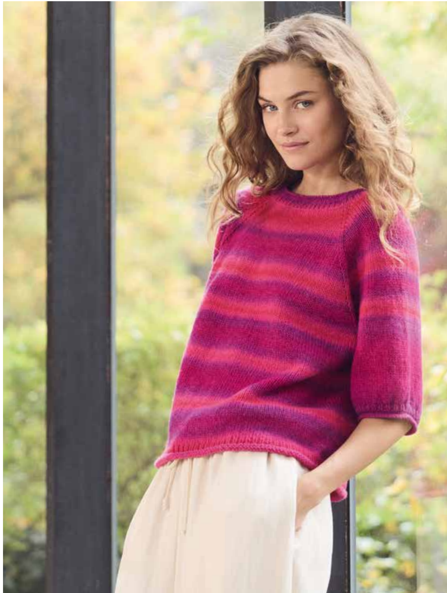
09 – CORALLO