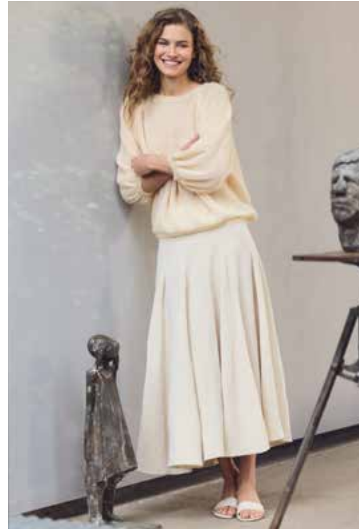
linke Seite: 18 – POPCORN | 19 – SETASURI