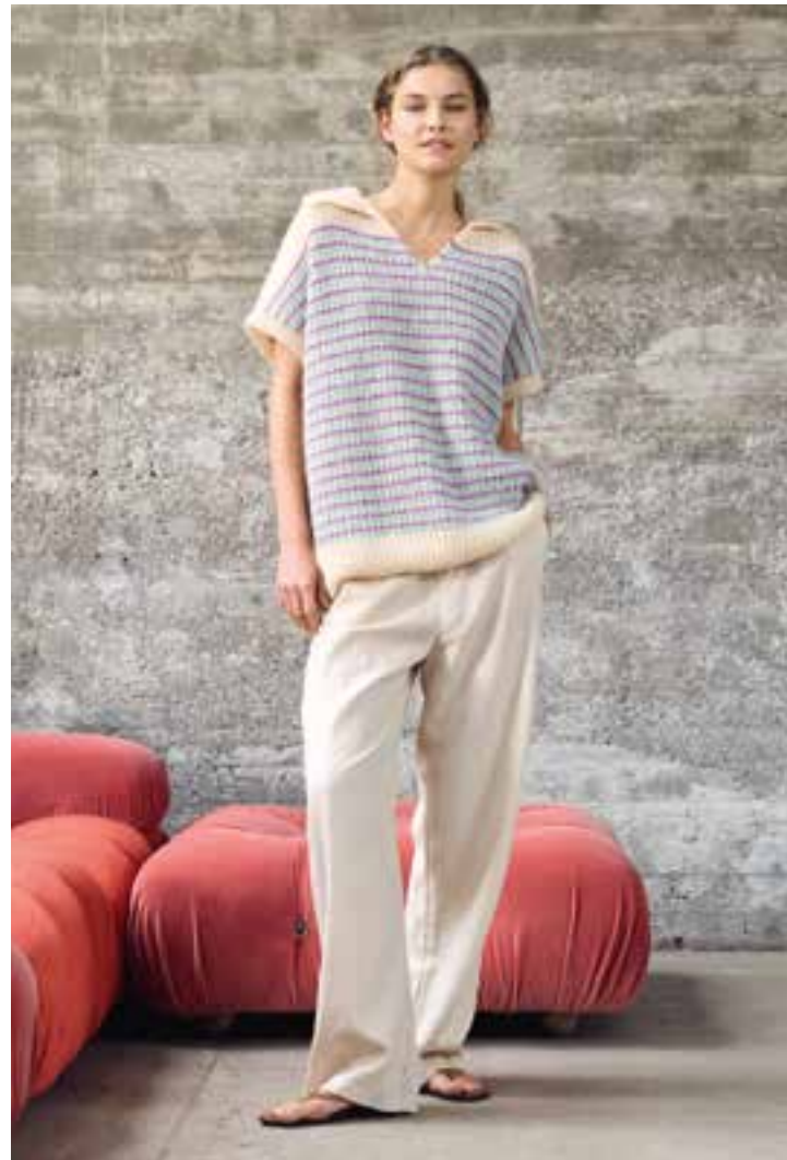
14 – SETASURI rechte Seite: 15 – POPCORN