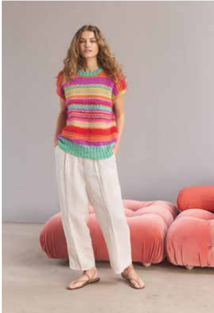
02 – BASTA + BOTTONI + SUMMER SOFTNESS rechte Seite: 03 – ECOPUNO + BASTA