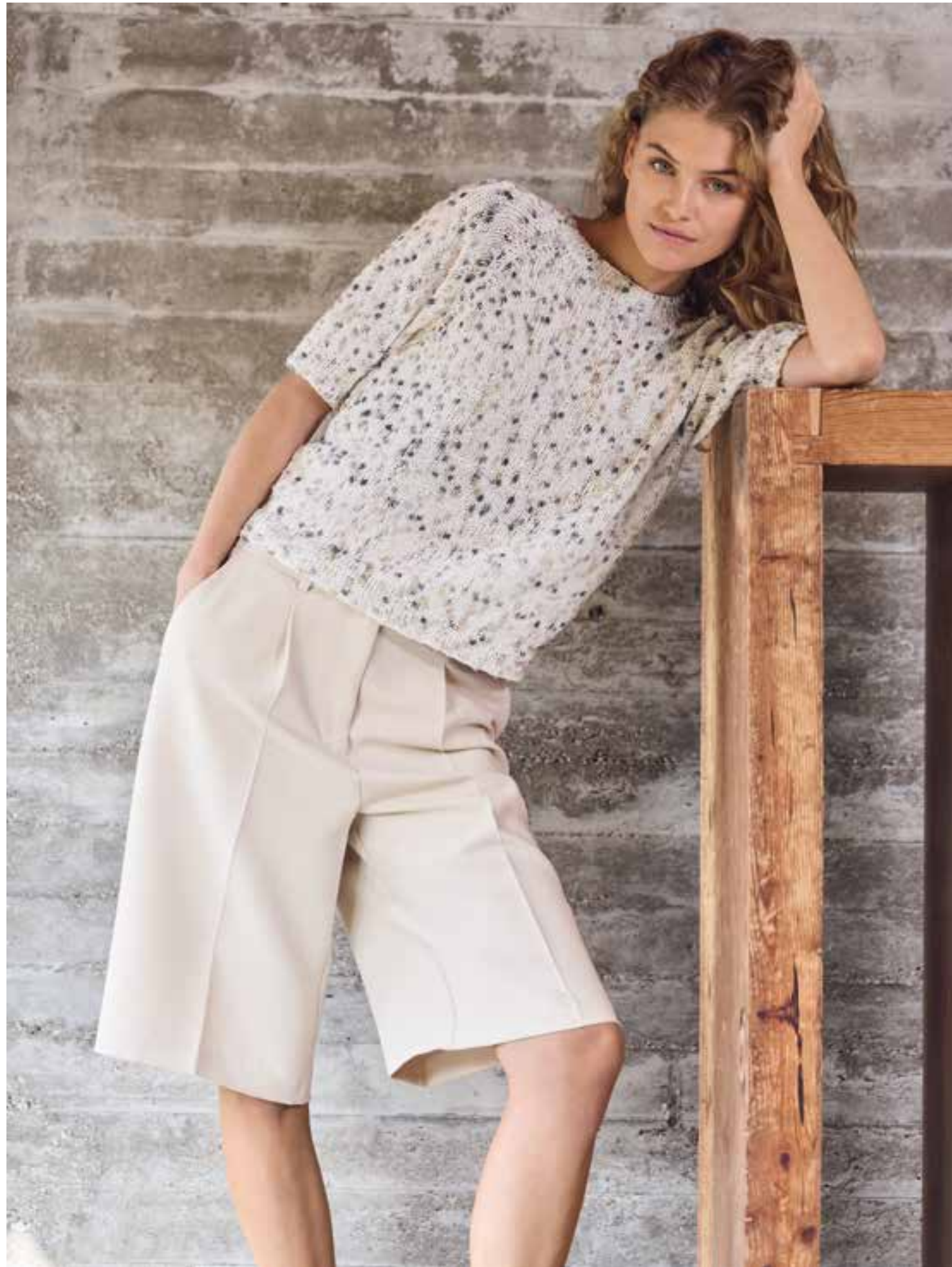
17 – POPCORN