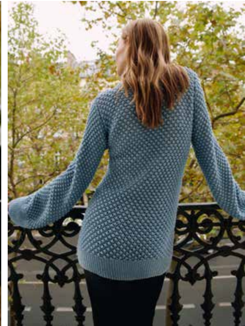
03 – Bella + Puno Due | 04 – Dodici