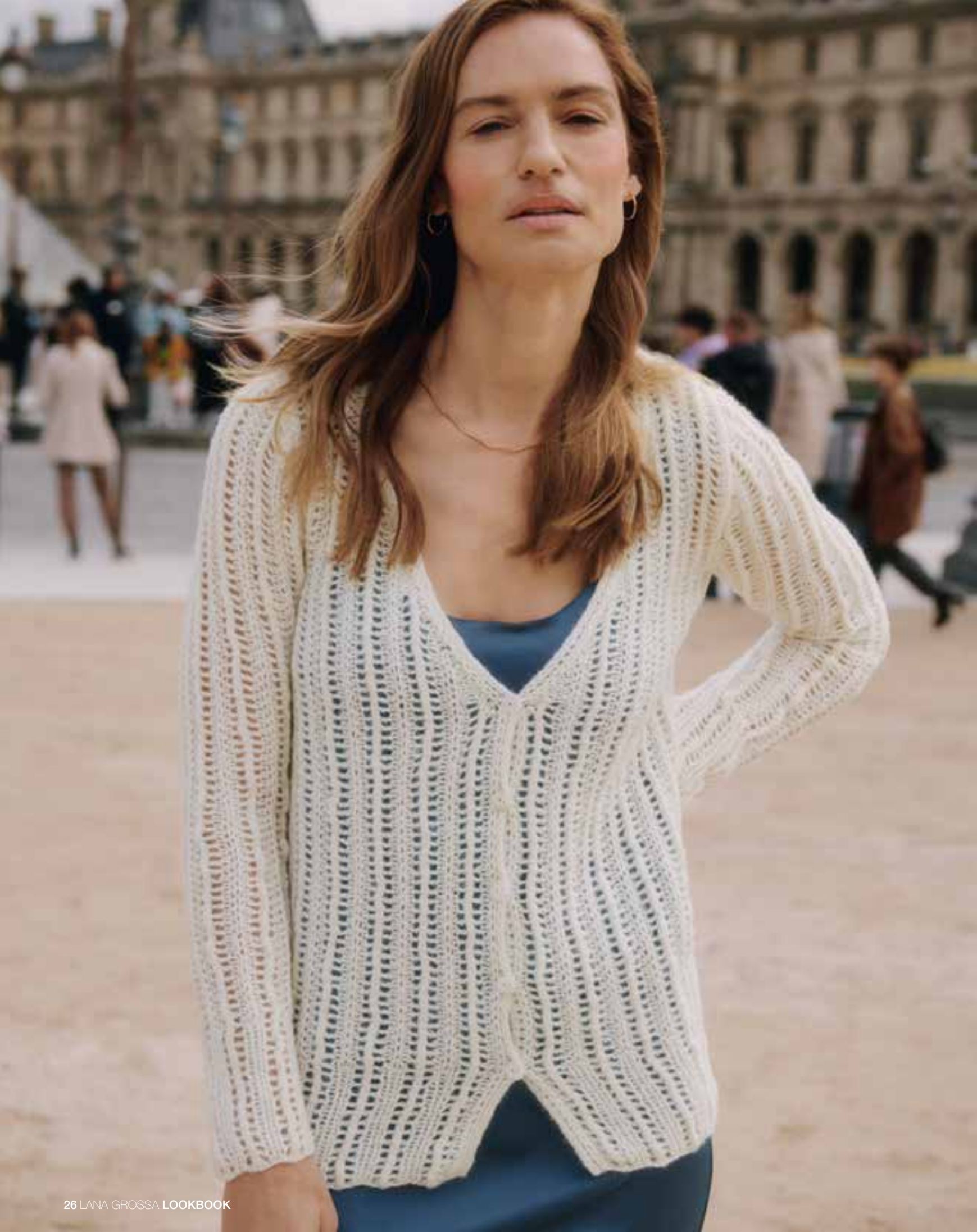
18 – Puno Luce + Bella | 19 | 20 – Dodici