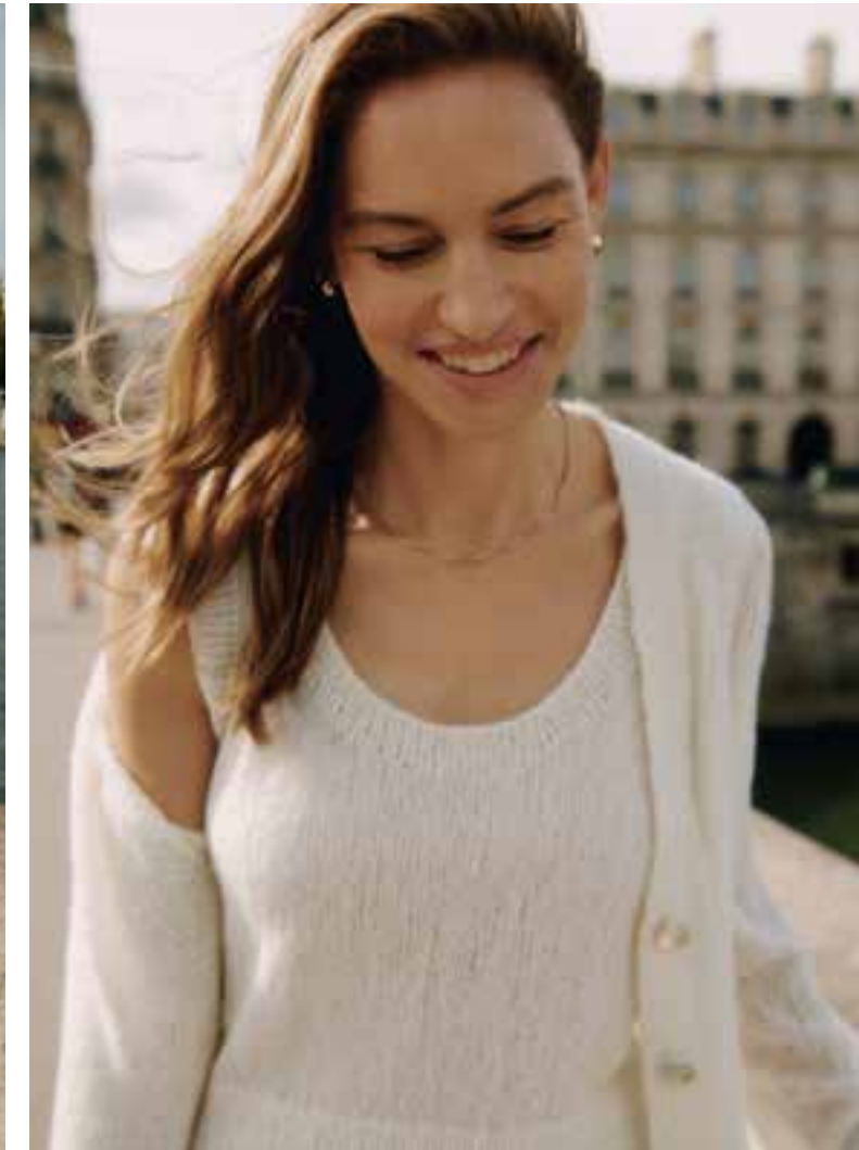
25 – Bella + Puno Due | 26 | 27 – Bella