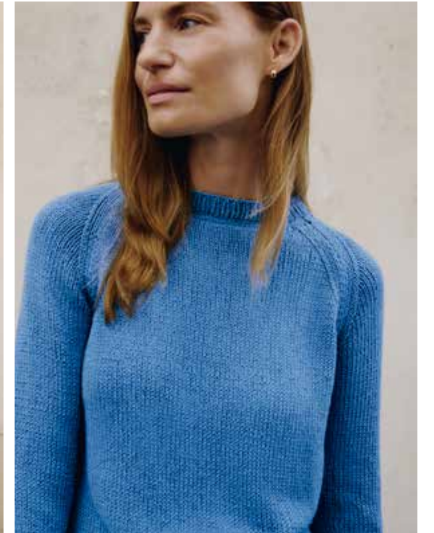
06 – The Tube | 07 – Dodici