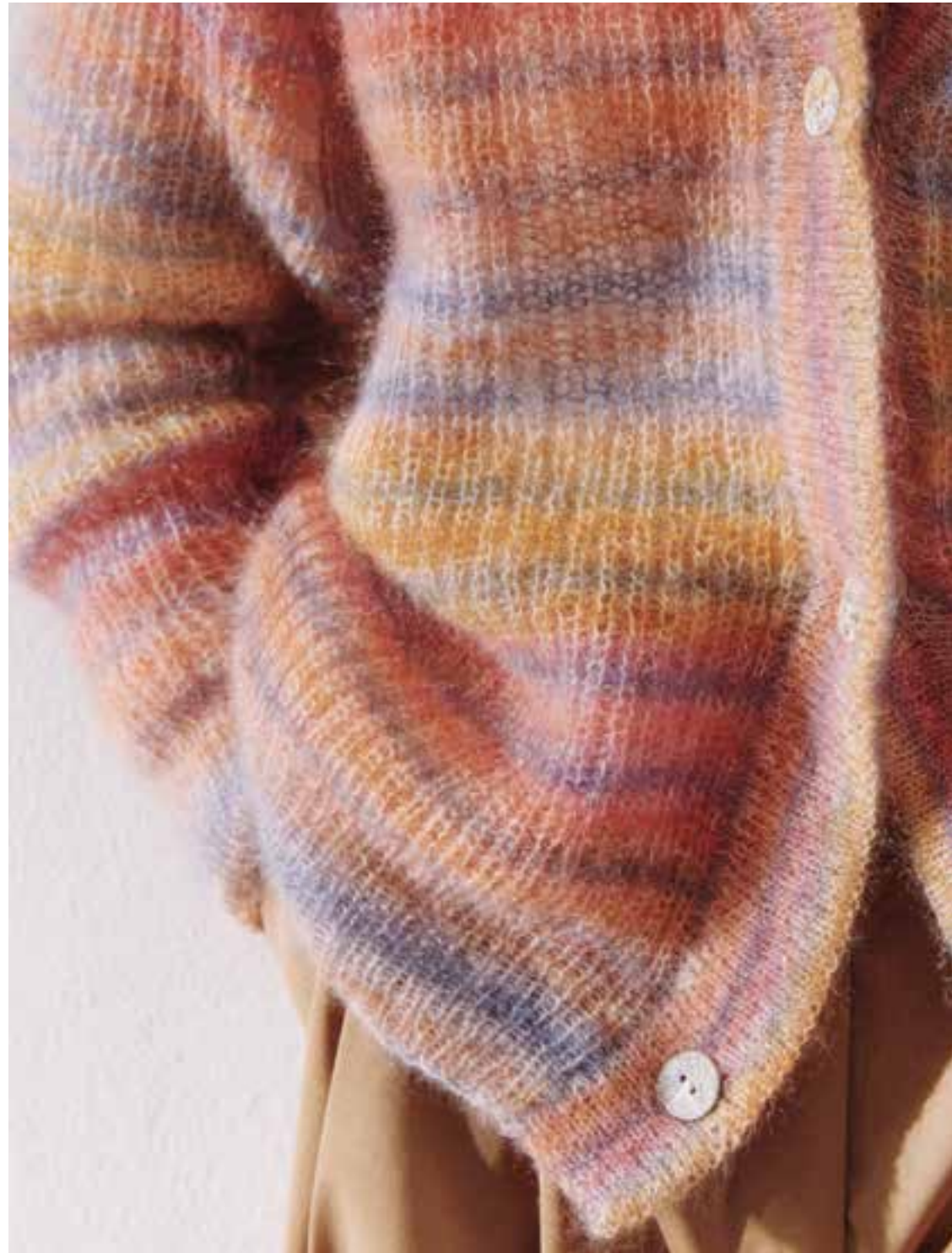
13 – Silkhair Print