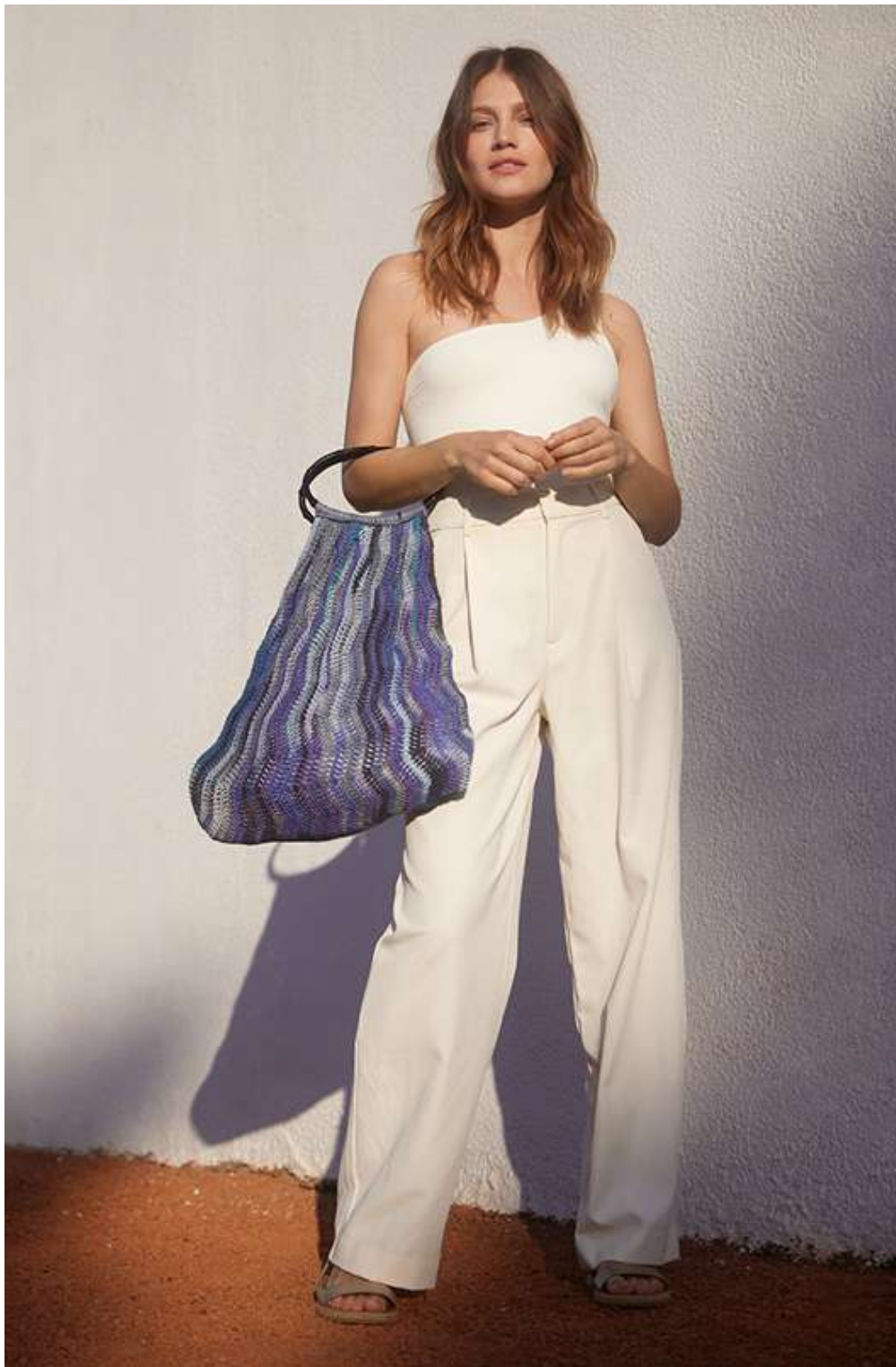
03 + 04 – Gomitolo LINO