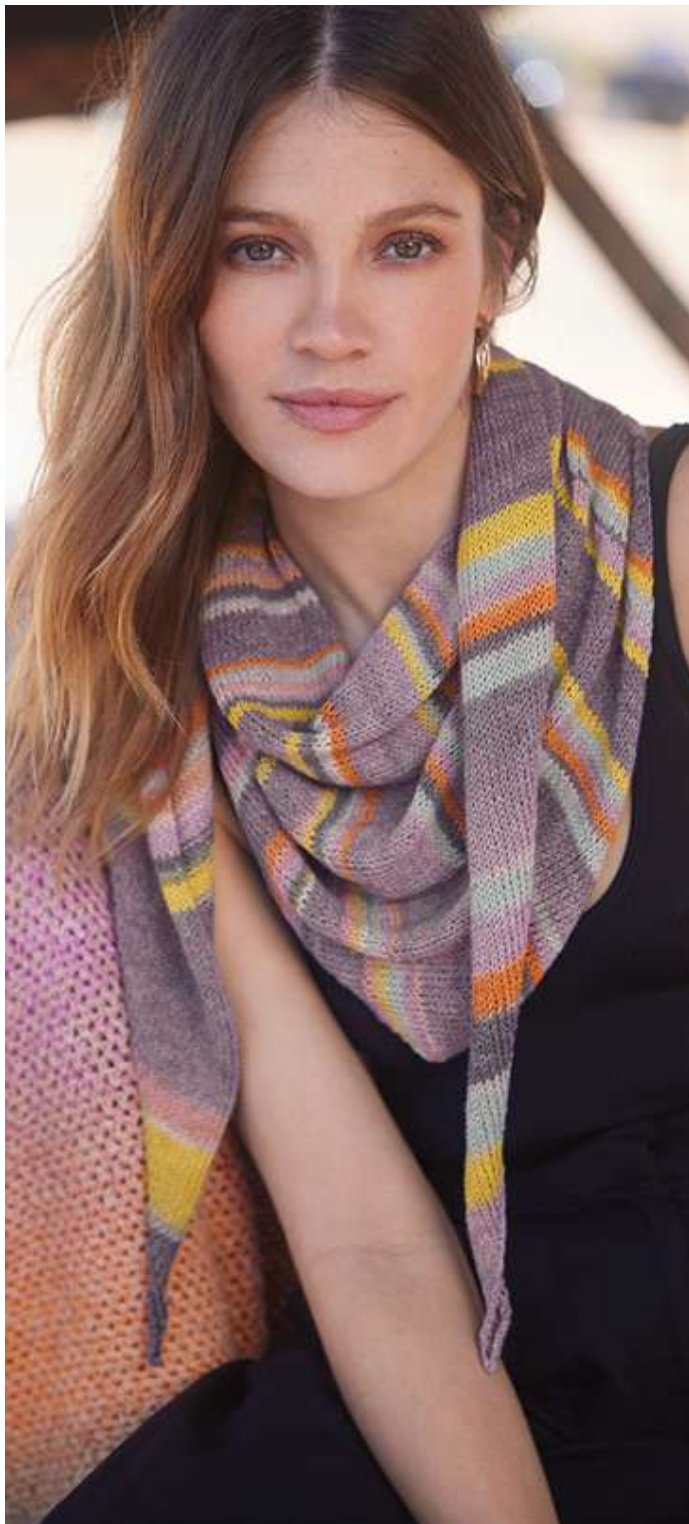
27 – Gomitolo LINO

Gomitolo MEILENWEIT 75 % Schurwolle (Merino superwash), 25 % Polyamid, ca. 400 m/100g, X 2,5–3 mm