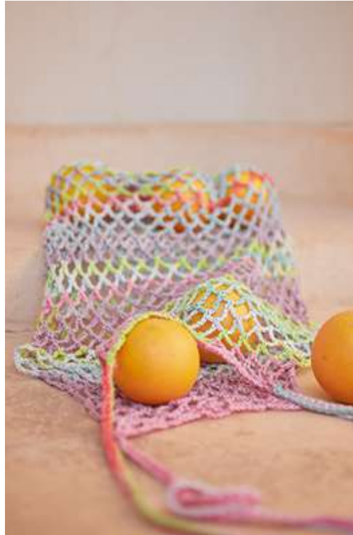
08 + 09 + 10 – Gomitolo LINO | rechts: 11 – Gomitolo SOLE