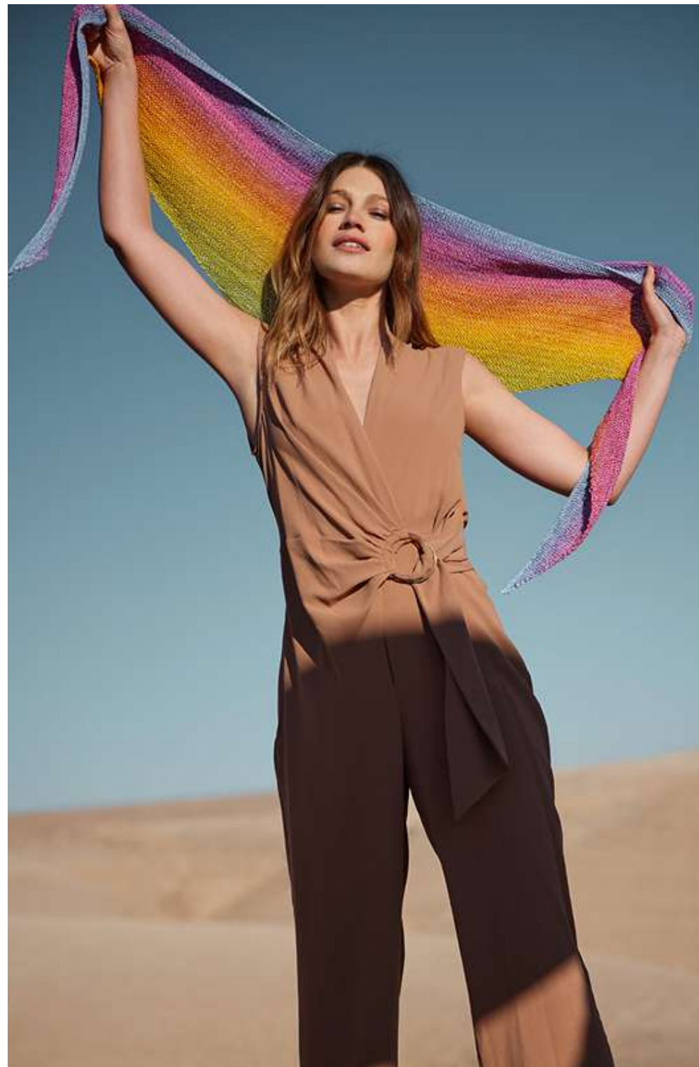
Gomitolo SOLE (07)