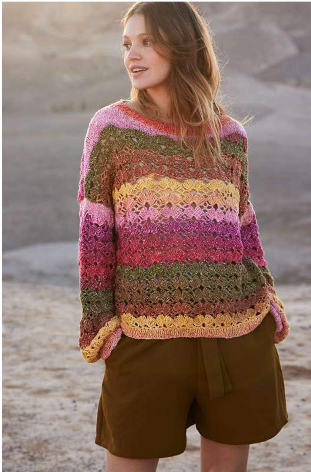
Gomitolo SOLE (07), -COLLINA (08), -COLLINA (13) | rechts: 21 – Gomitolo COLLINA