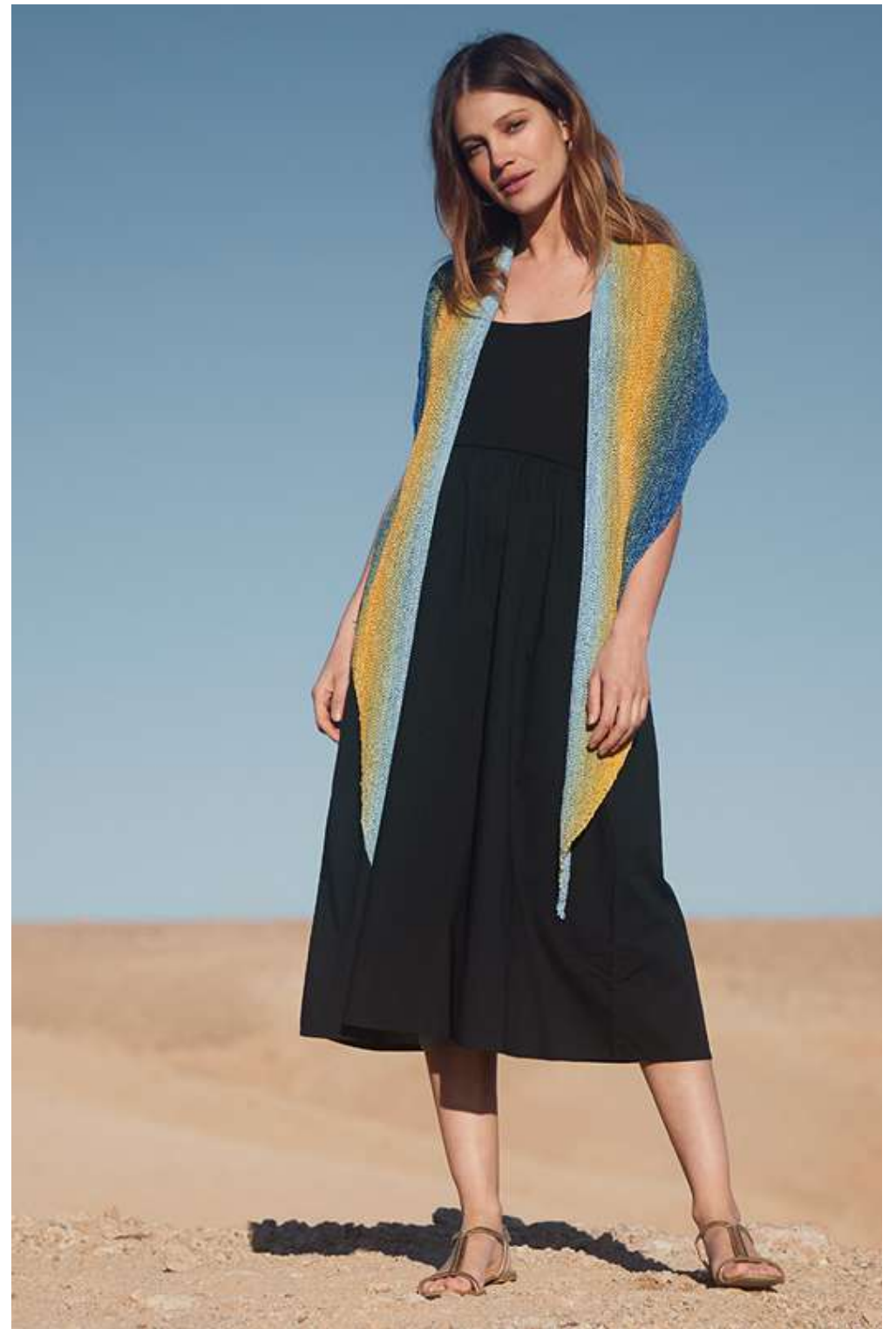
06 + 07 – Gomitolo SOLE