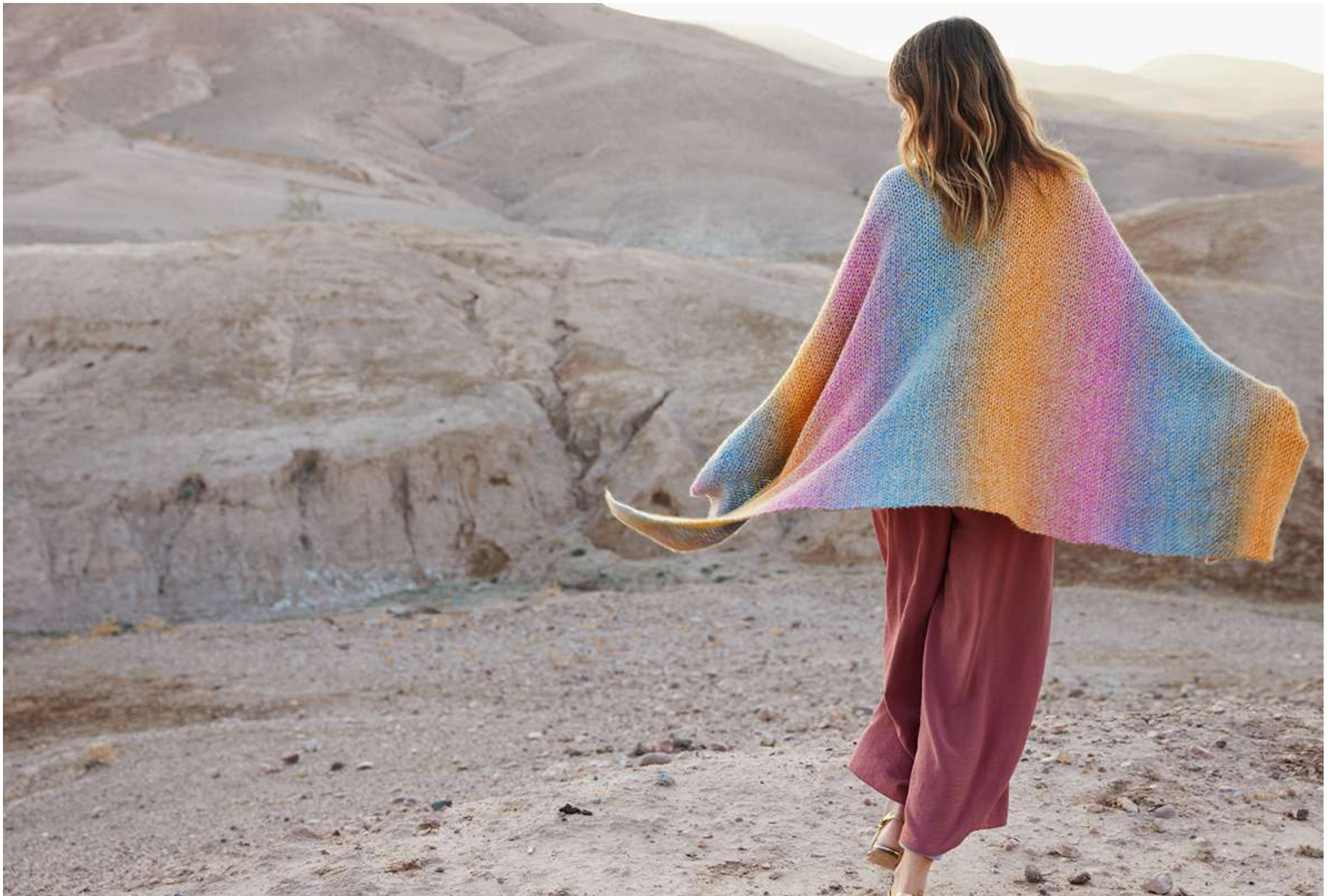
26-Gomitolo SOLE + Bella