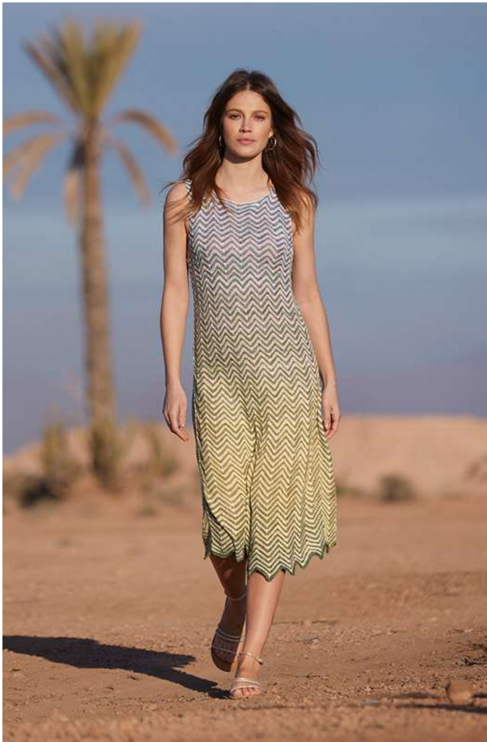
19 – Gomitolo SOLE | rechts: 20 – Gomitolo COLLINA + Gomitolo LINO