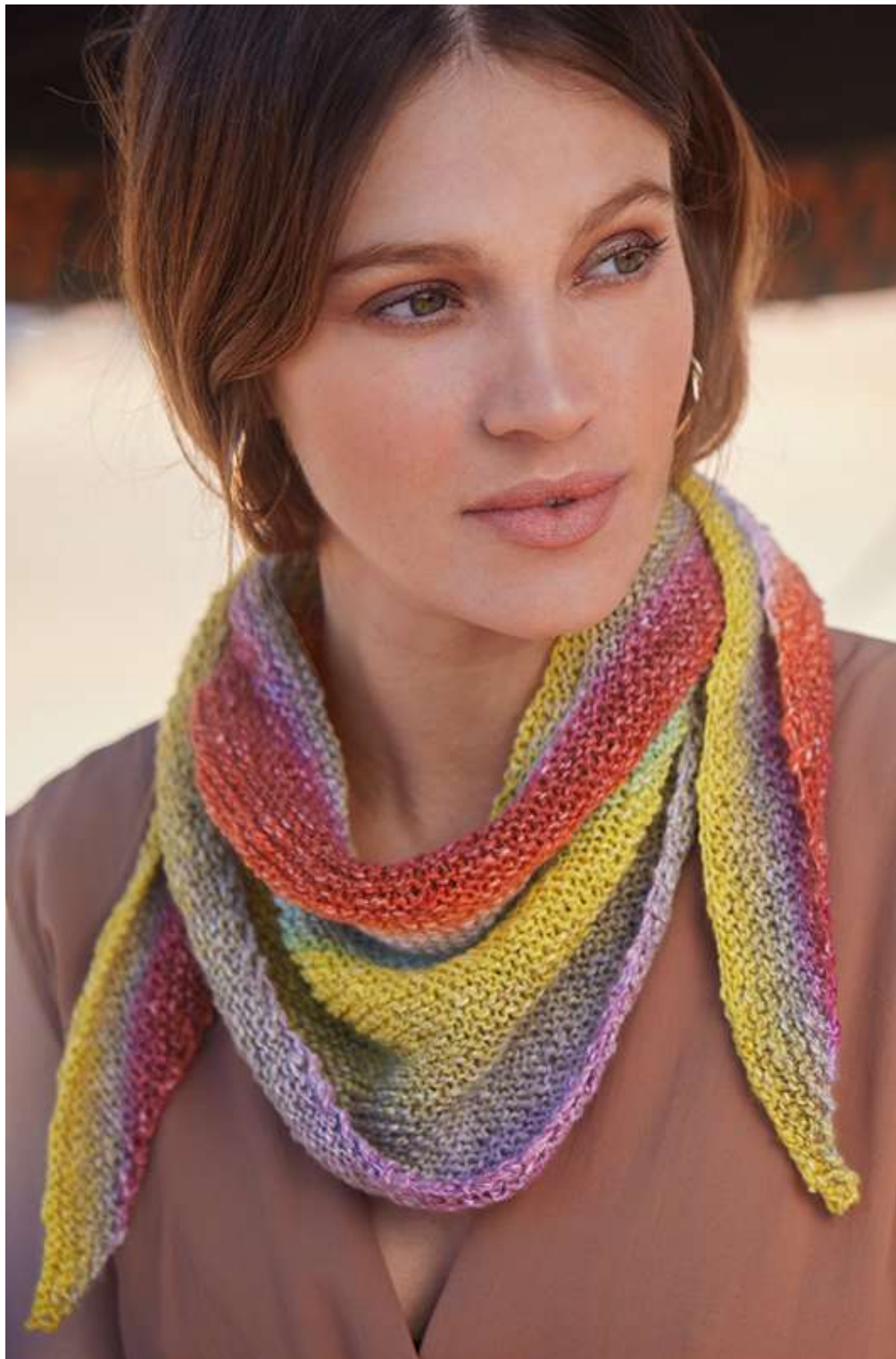
links: 12 – Gomitolo LINO | Gomitolo COLLINA (08)