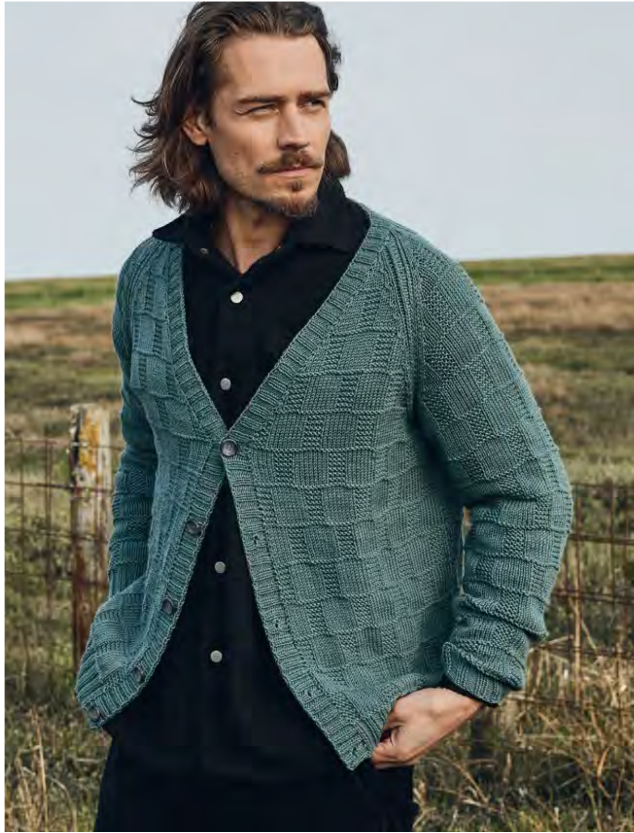
23 – JACKE COOL WOOL BIG | 24 + 25 – MÜTZE, SCHAL MERINO UNO