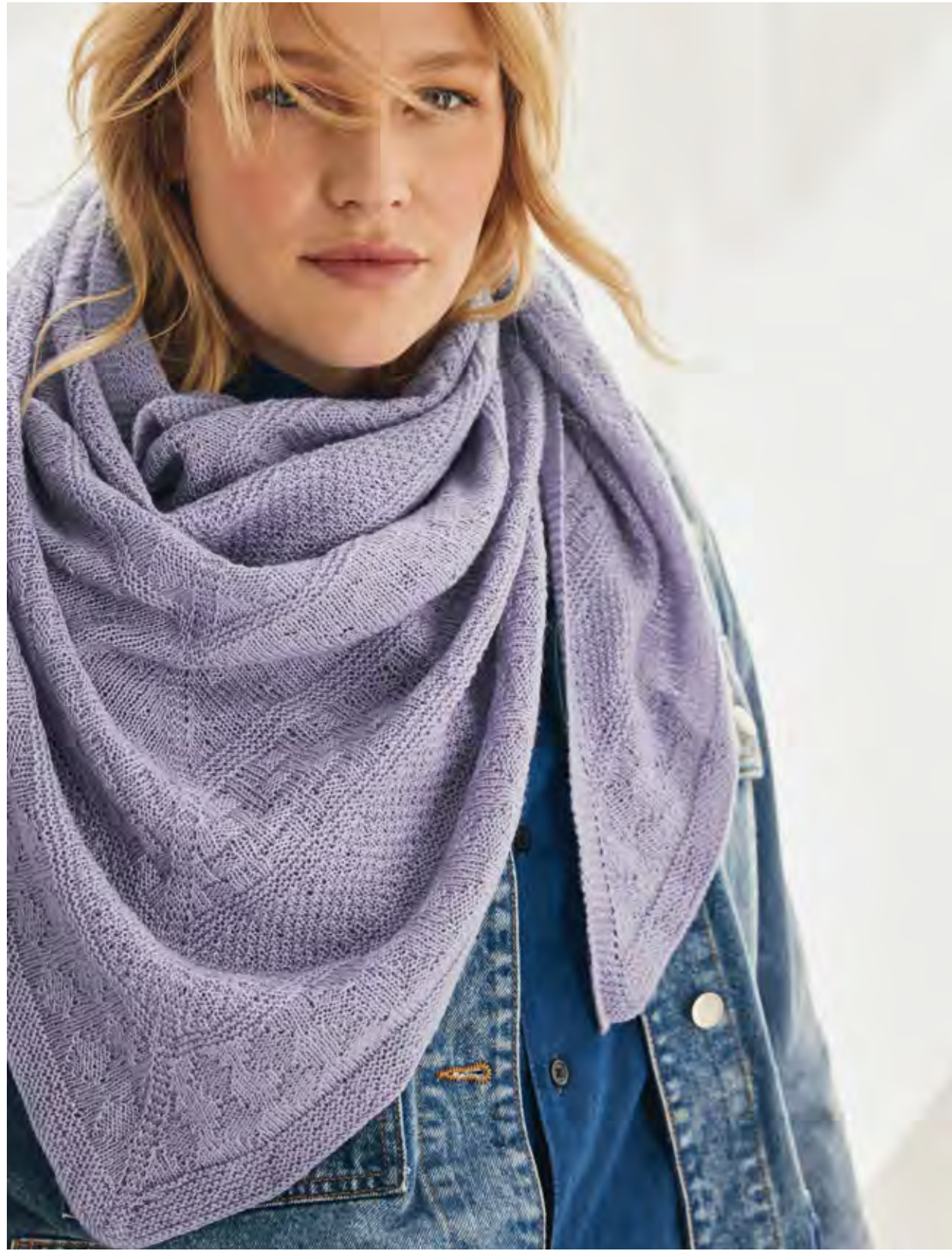
43 – DREIECKSTUCH COOL WOOL LACE | 44 – PONCHO BINGO