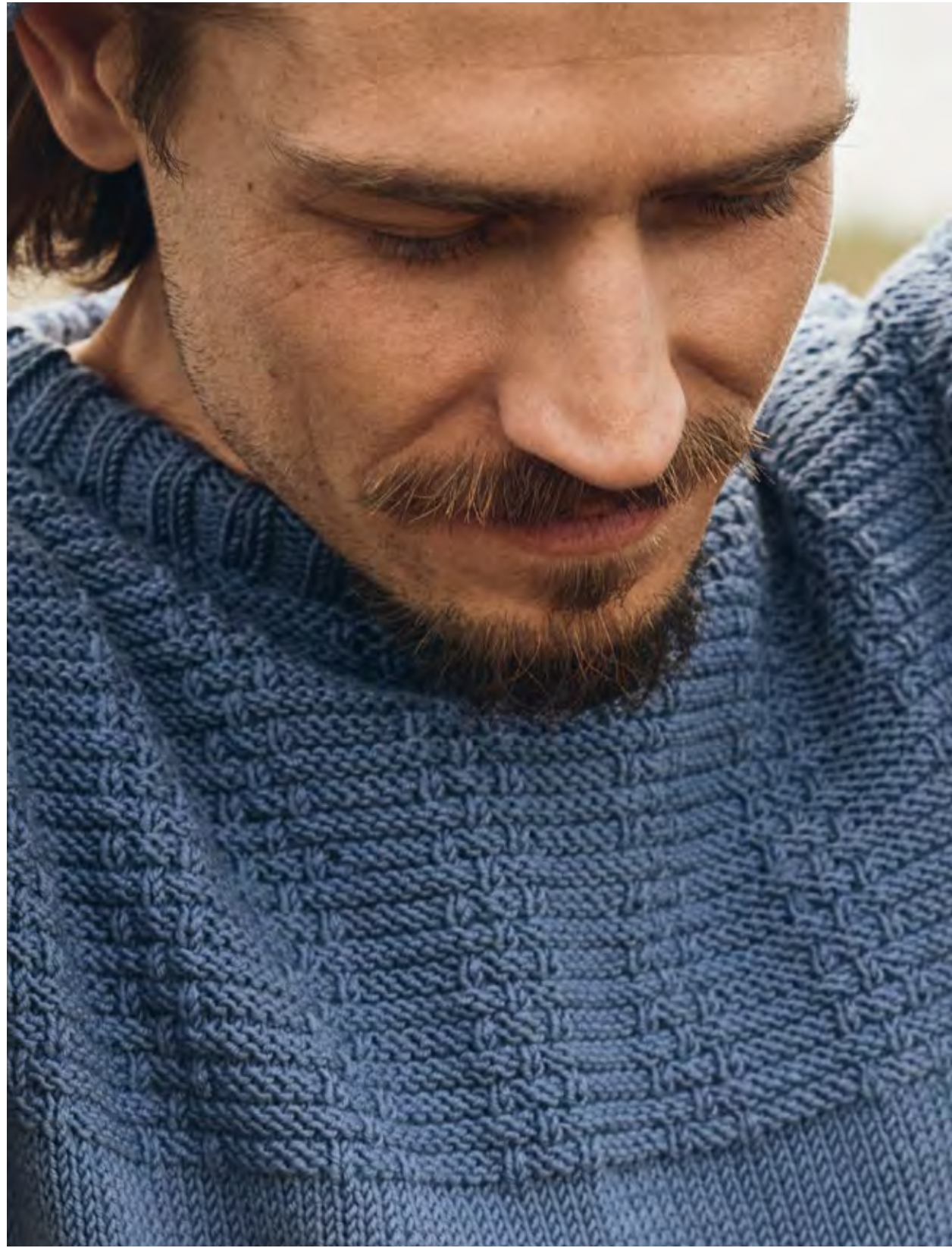
26 – PULLOVER COOL WOOL