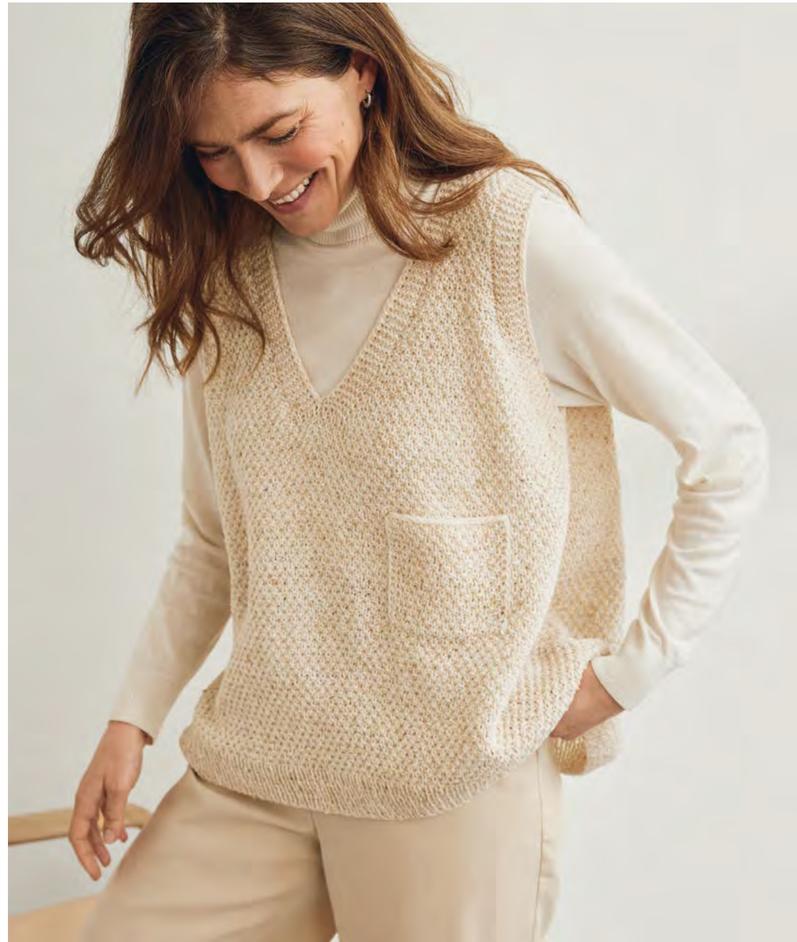
36 – PULLUNDER MERINO SUPERIORE | 37 – COUNTRY TWEED FINE (LANDLUST SOFT TWEED 180)