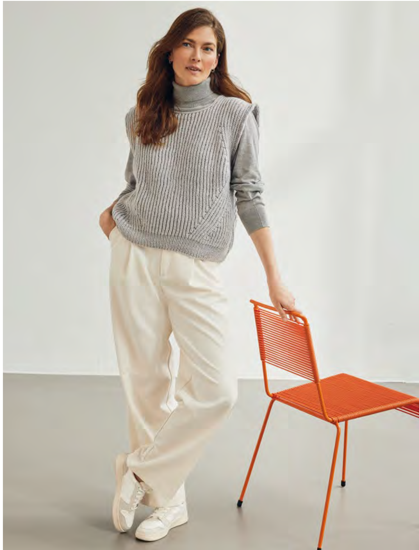
47 – PULLUNDER MERINO UNO