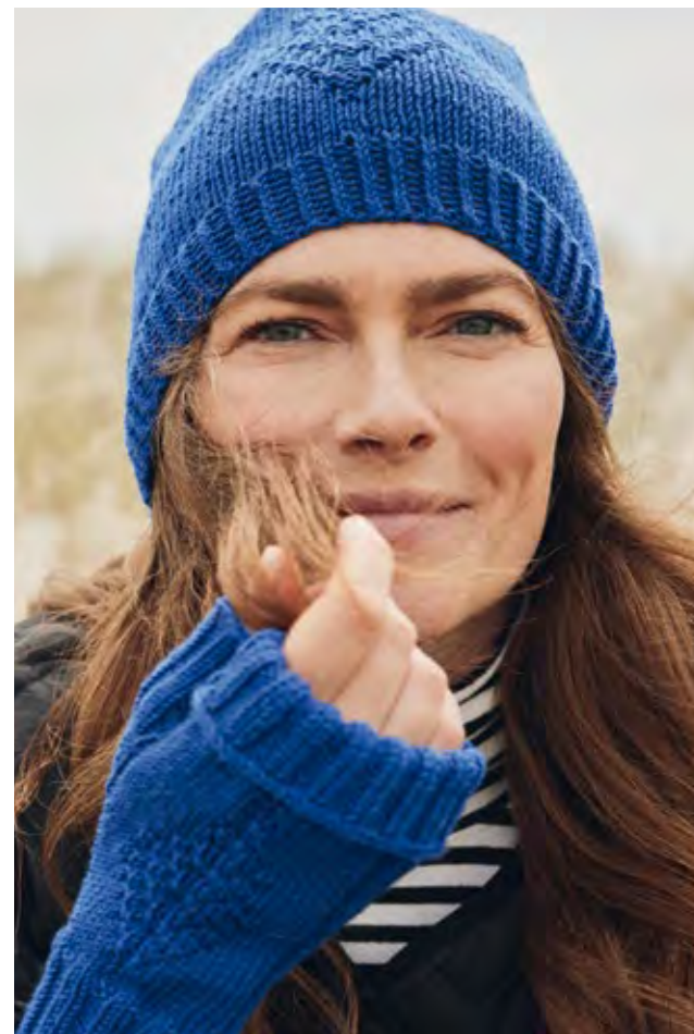
01 – PULLOVER COOL WOOL BIG | MÜTZE, STULPEN COOL WOOL (Mod. 14 + 15, Seite 17)