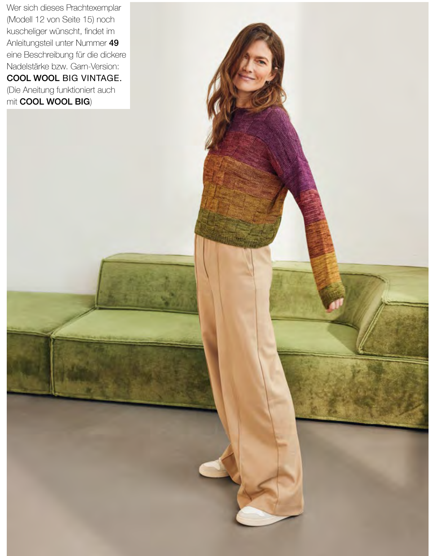
PULLOVER – COOL WOOL VINTAGE , Mod.12 von Seite 15

Wer sich dieses Prachtexemplar (Modell 12 von Seite 15) noch kuscheliger wünscht, findet im Anleitungsteil unter Nummer 49 eine Beschreibung für die dickere Nadelstärke bzw. Garn-Version: COOL WOOL BIG VINTAGE . (Die Anleitung funktioniert auch mit COOL WOOL BIG )