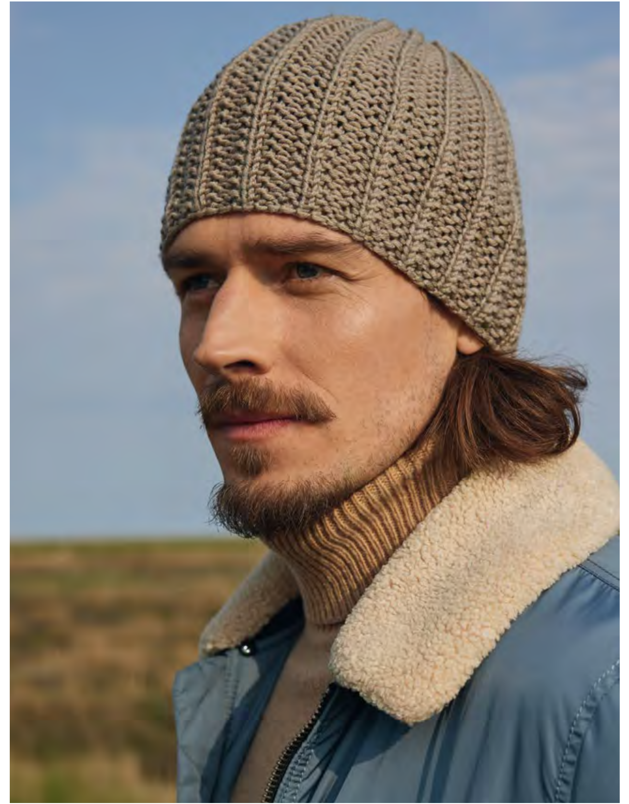
27 – ROLLKRAGEN-EINSATZ COOL WOOL BIG | 28 – MÜTZE BINGO