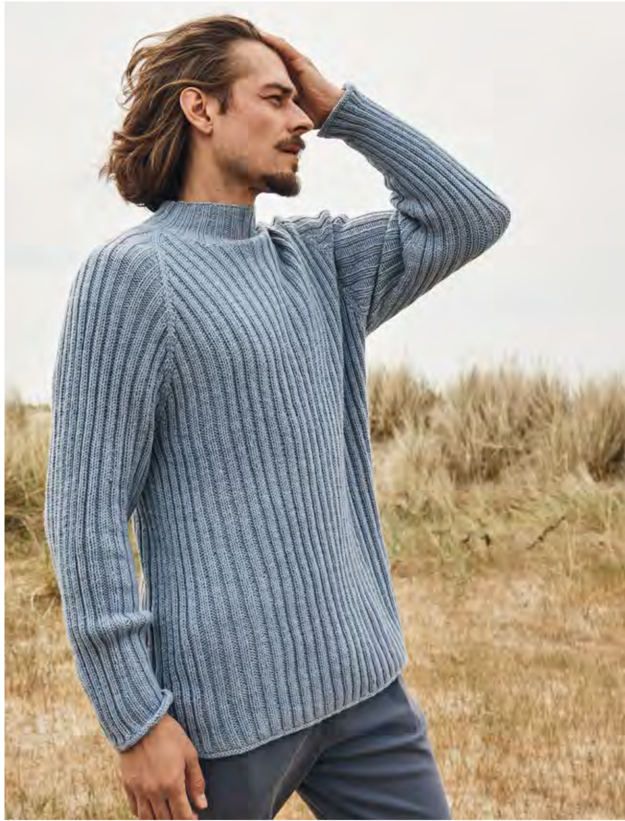
18 – PULLOVER MERINO UNO | 19 – JACKE COOL WOOL SETA