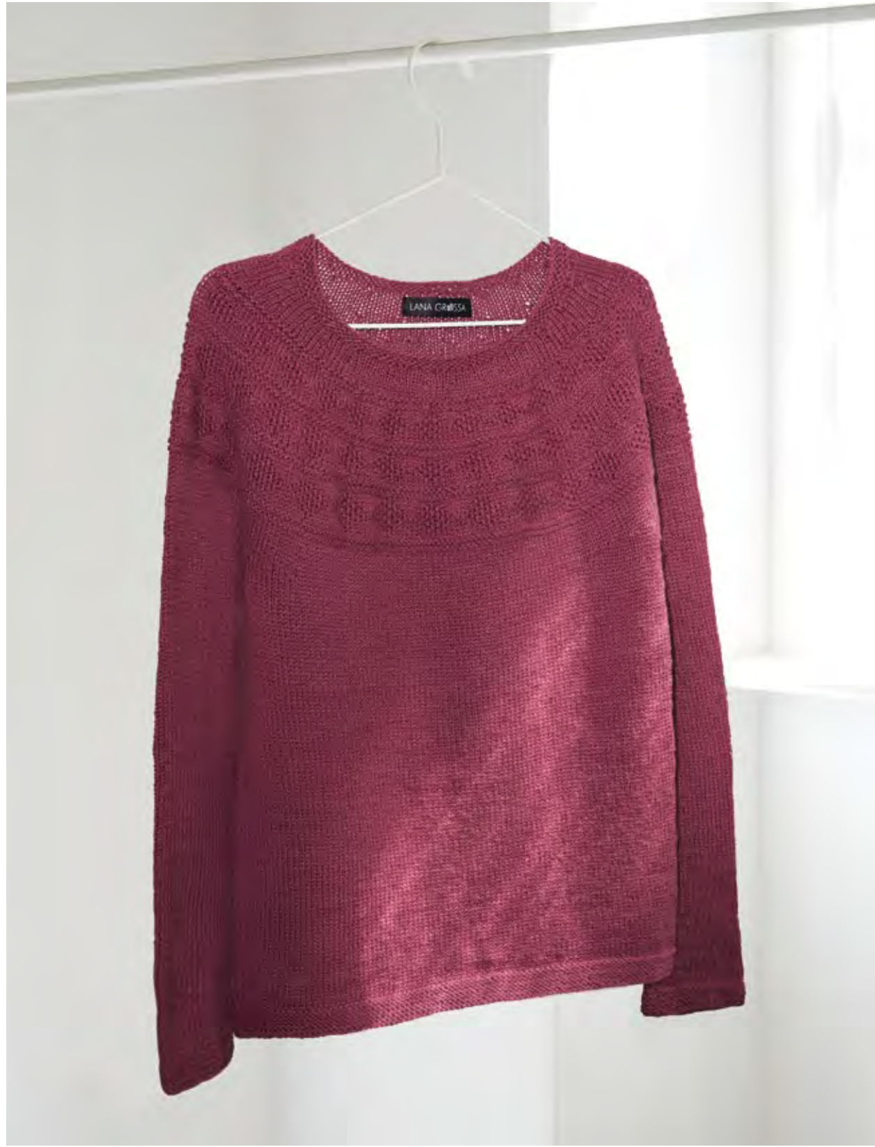
32 – PULLOVER MERINO UNO