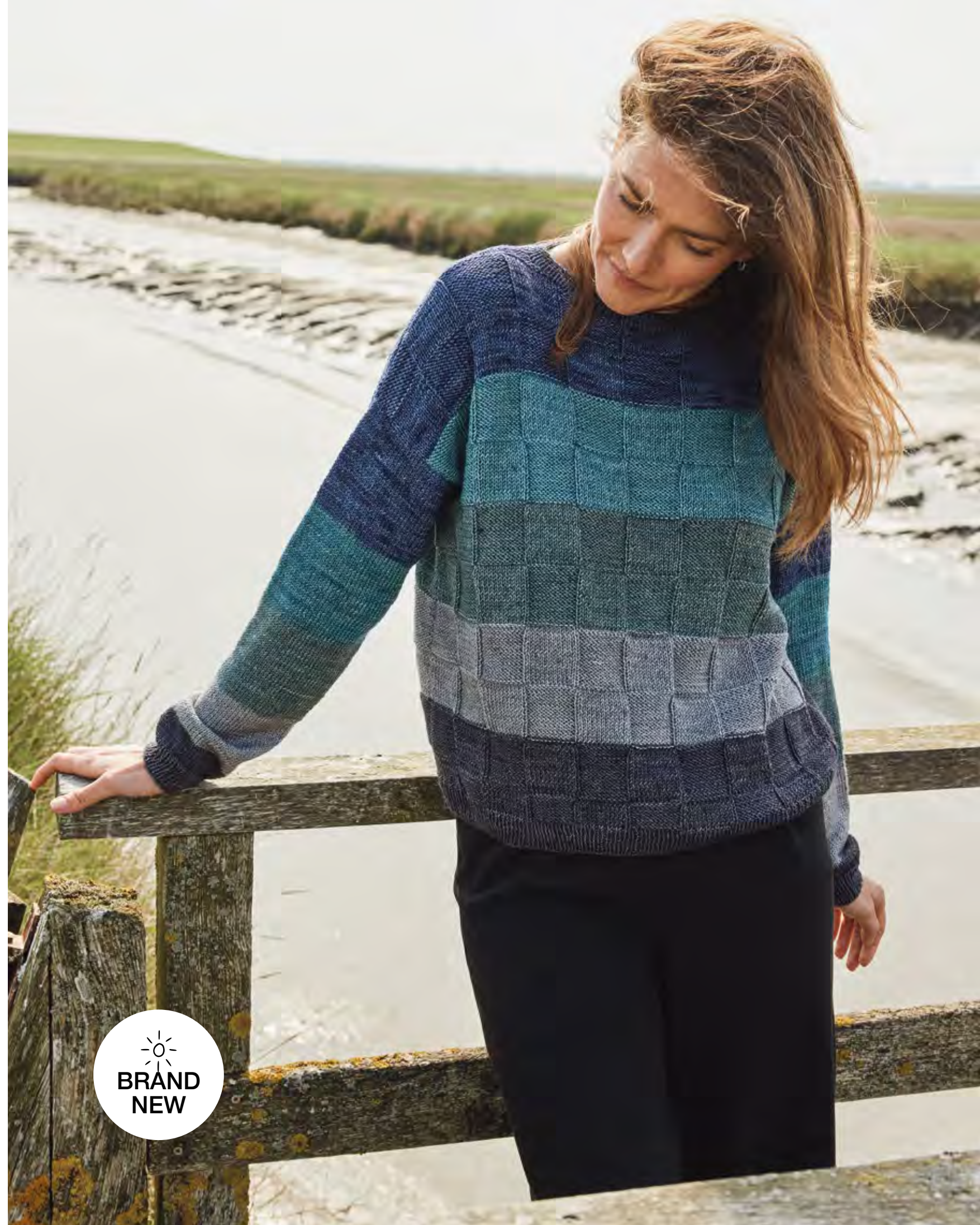
rechte Seite: 12 – PULLOVER COOL WOOL VINTAGE (Die Anleitung funktioniert auch mit COOL WOOL)