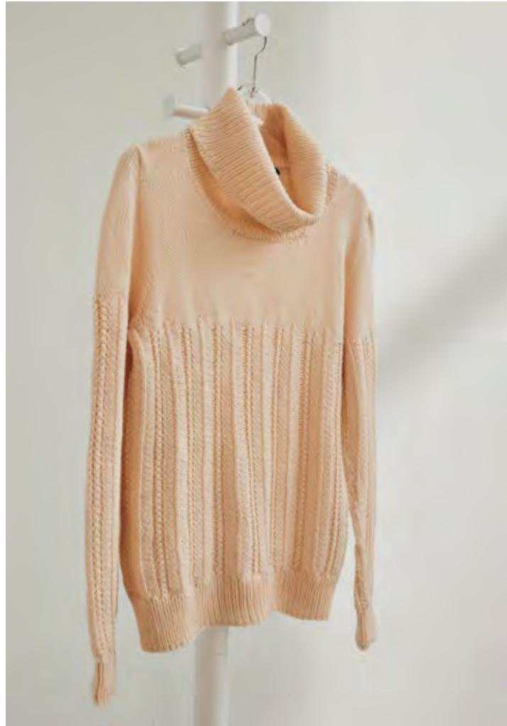
40 | 41 – PONCHO | PULLOVER (Mitte und rechts) COOL WOOL BIG