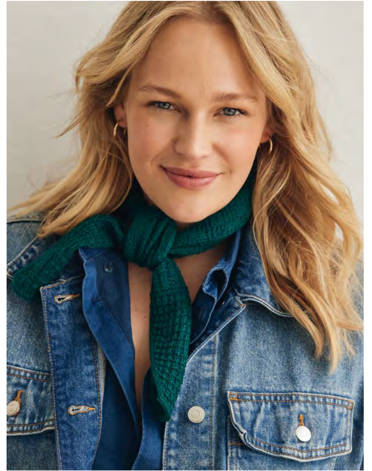
38 – PULLOVER MERINO UNO | 39 – HALSTUCH COOL WOOL LACE