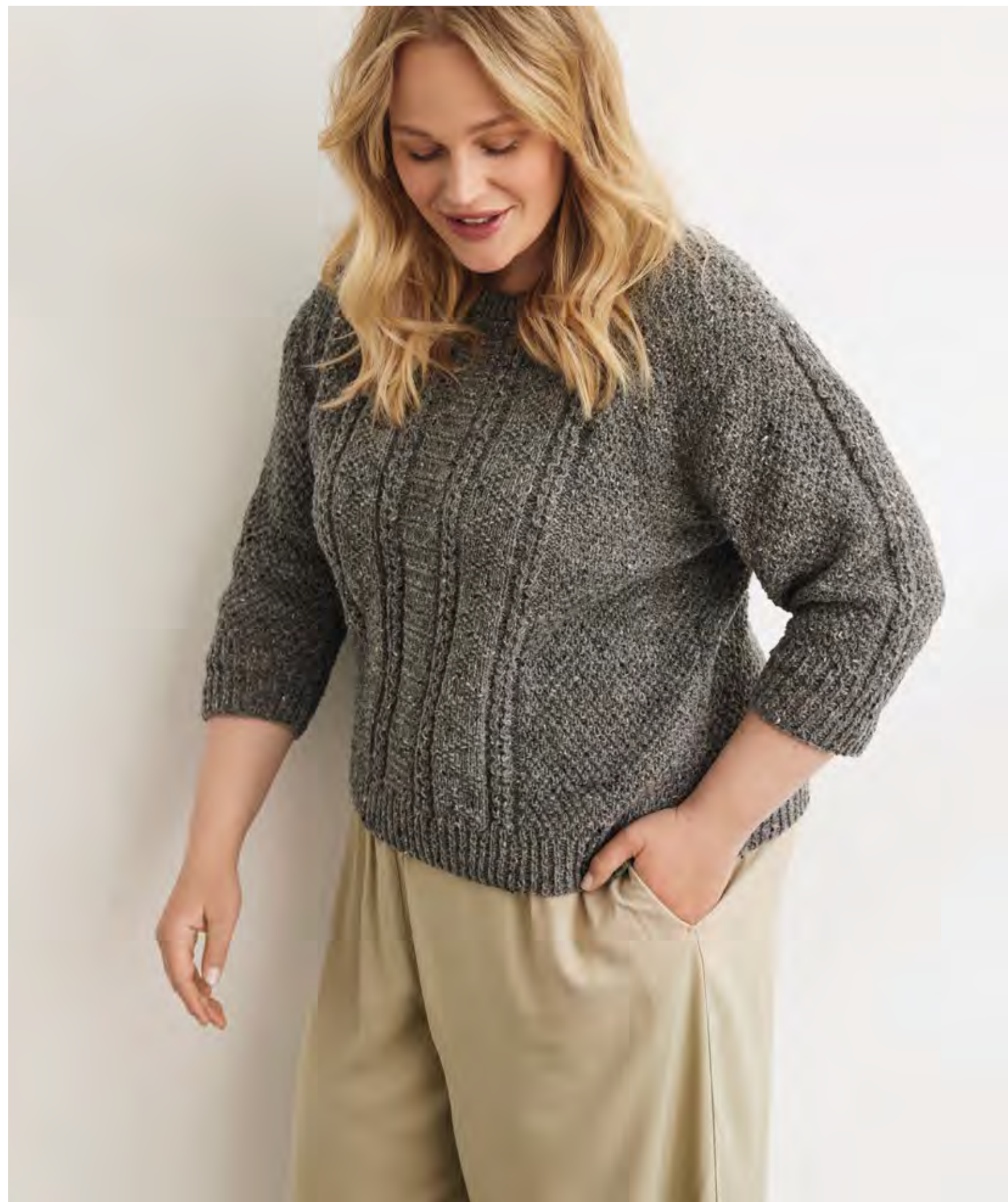
42 – PULLOVER COUNTRY TWEED FINE (LANDLUST SOFT TWEED 180)