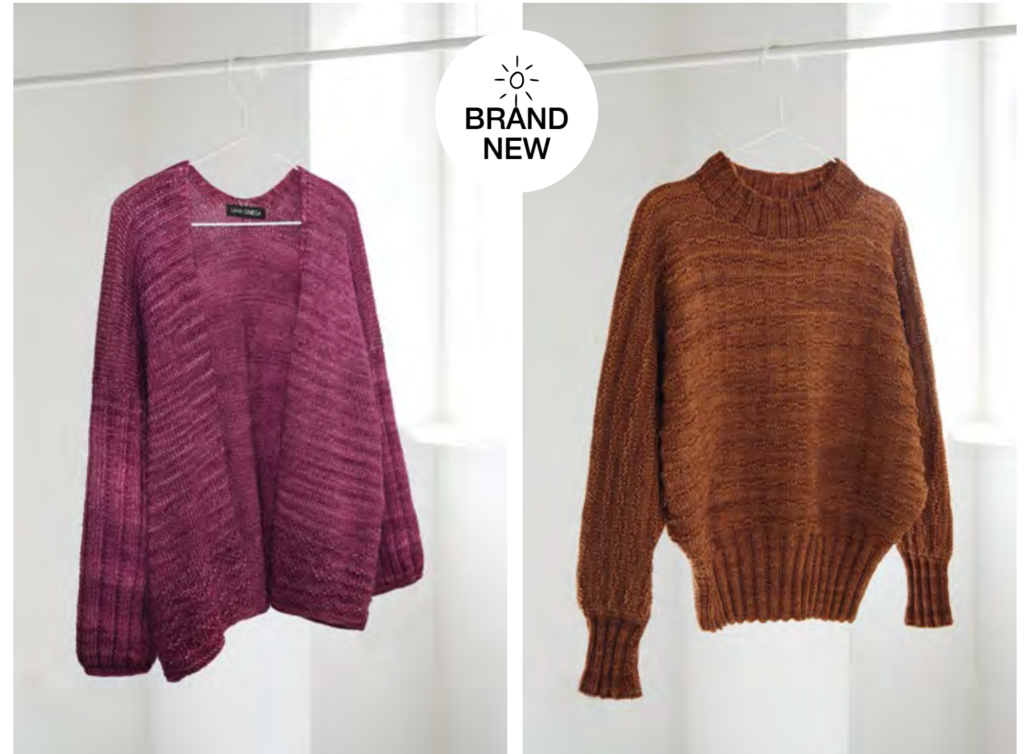
33 – CARDIGAN COOL WOOL BIG | COOL WOOL BIG VINTAGE rechts: PULLOVER COOL WOOL BIG VINTAGE (Mod. 01 von Seite 4/5)