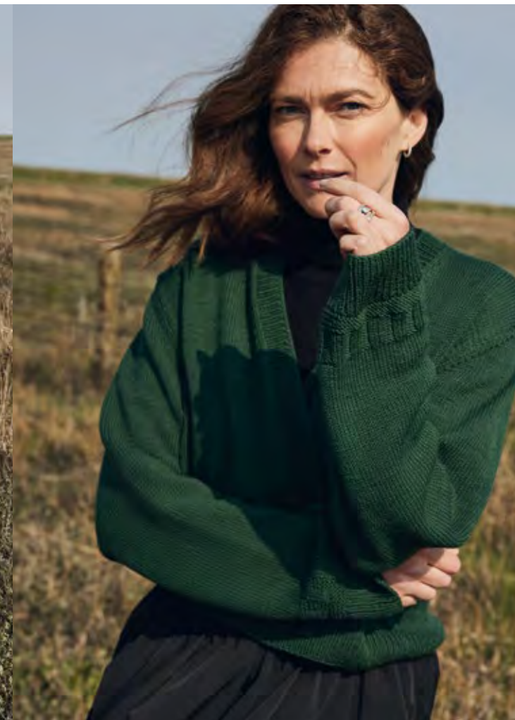
03 – JACKE MERINO SUPERIORE