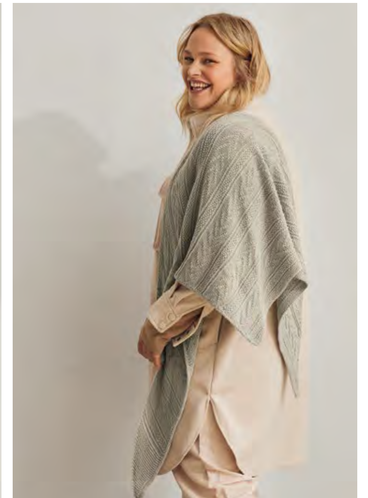
45 – DREIECKSTUCH COOL WOOL SETA