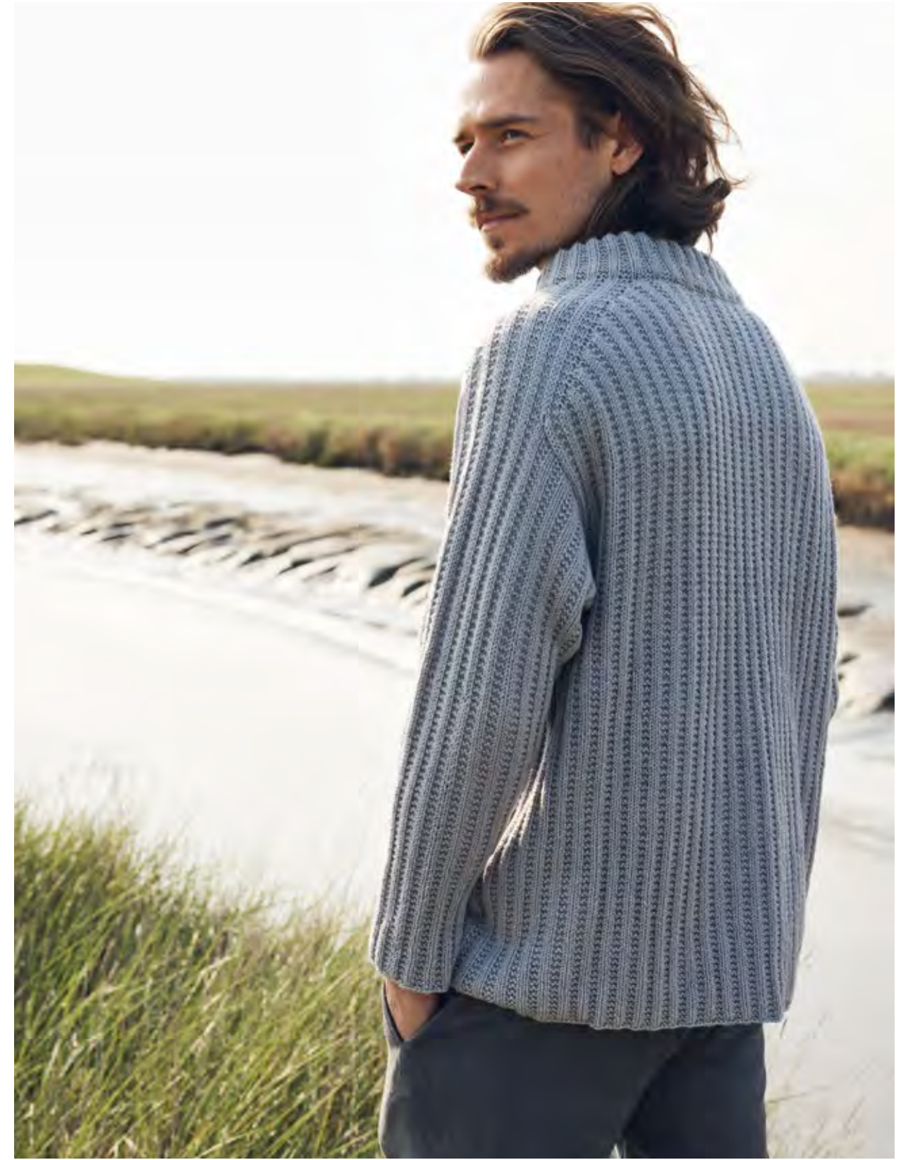
22 – PULLOVER COOL WOOL BIG