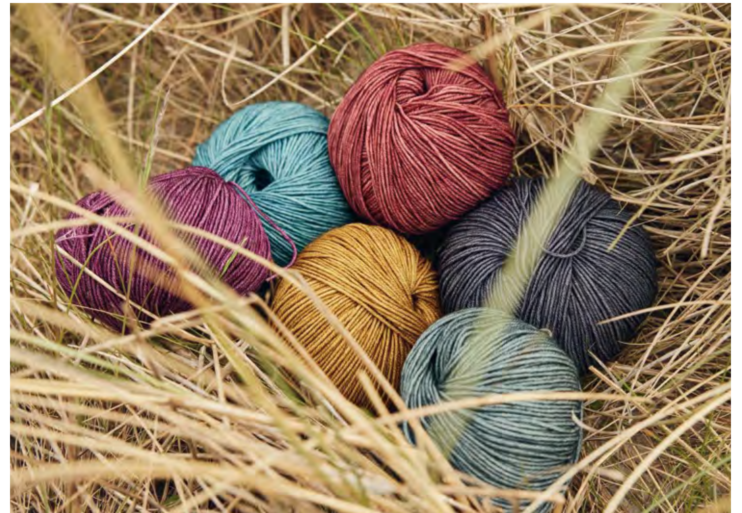
07 – ROLLKRAGEN-EINSATZ COOL WOOL VINTAGE

Auf den Nadeln unverzichtbar sind die bewährten Klassiker COOL WOOL und COOL WOOL BIG. In dieser Saison überraschen beide Qualitäten als dezent bedruckte Version in zehn Farben. Neben Anthrazit und Hellgrau gibt es acht edle Töne, die durch ihre leicht changierende Optik an Juwelen erinnern. Das Ergebnis sind ausdrucksvolle Strickbilder, die auch einfache Teile gut aussehen lassen.