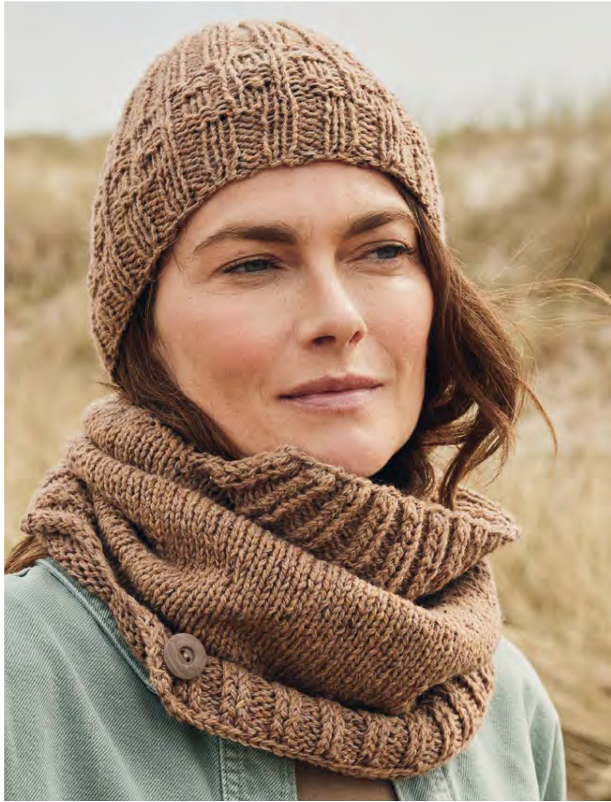
04 + 05 – MÜTZE, LOOP COUNTRY TWEED FINE (LANDLUST SOFT TWEED 180) + COOL WOOL LACE | 06 – LOUNGE PANTS COOL WOOL