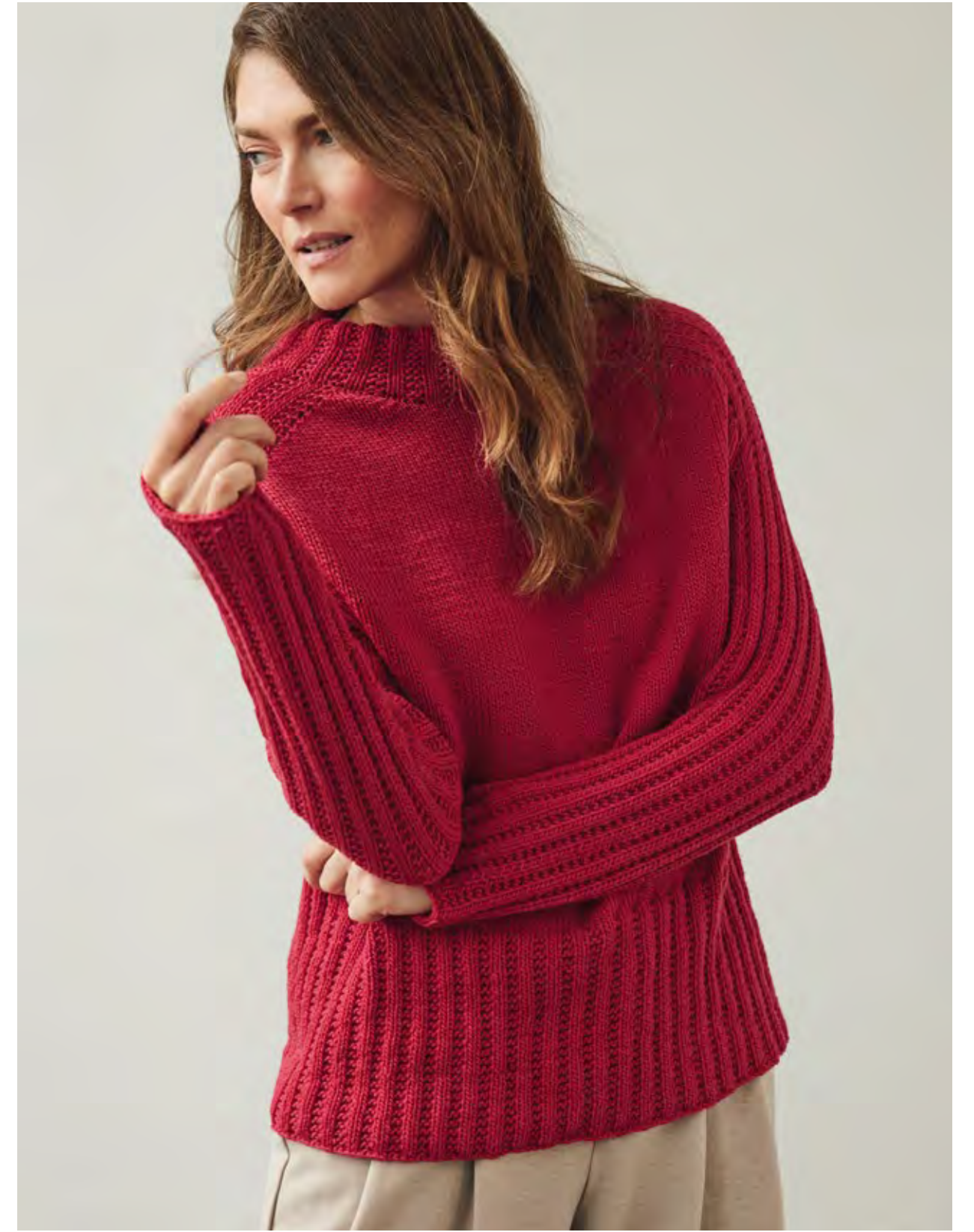
50 – V-PULLOVER MERINO UNO | 51 – PULLOVER COOL WOOL BIG