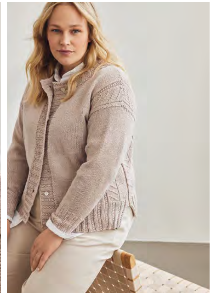
29 – JACKE COOL WOOL BIG