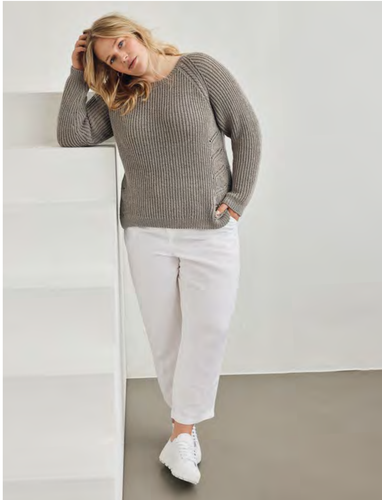
34 – PULLOVER COOL WOOL , rechts: 35 – ROLLKRAGEN-EINSATZ BINGO