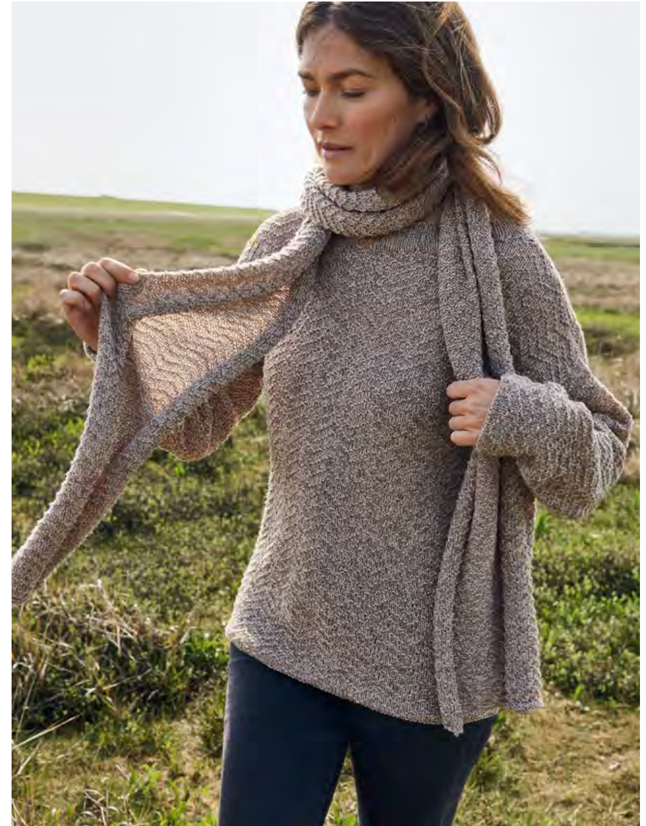
16 + 17 – PULLOVER, SCHAL COOL WOOL LACE