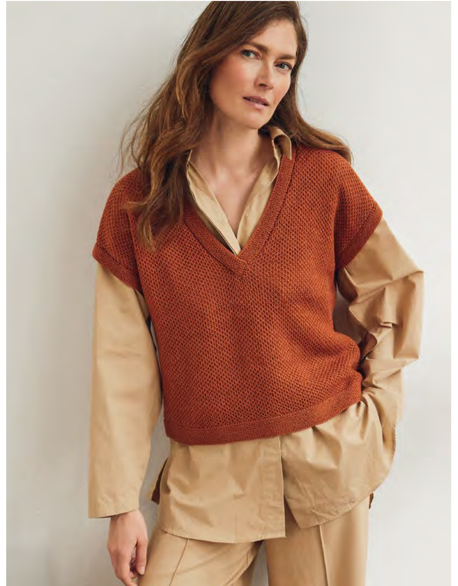
48 – PULLUNDER COOL WOOL LACE