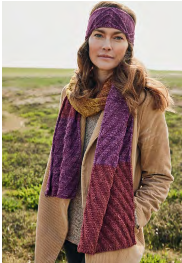
08 + 09 – MÜTZE, SCHAL COOL WOOL VINTAGE