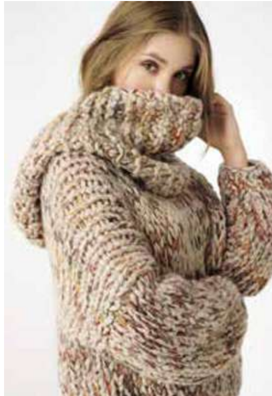
Easy going 52