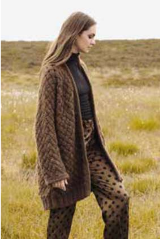
Beautiful country living 36