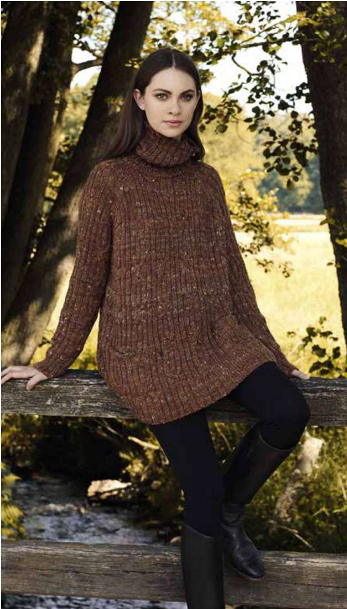
DEZE WIJDE TRUI draagt u het beste met een smalle broek en wanneer u wilt, met hoge smalle laarzen. Dan past ie ook voor grote maten en ronde heupen worden gecacheerd. Model 43 - Only Tweed.