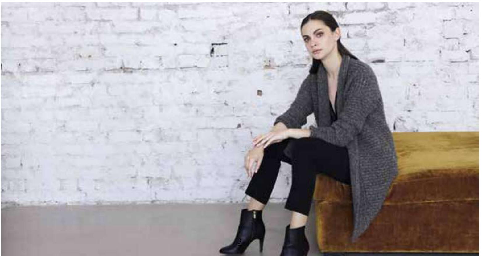
Classic style 4