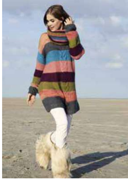
Beach life in color 22