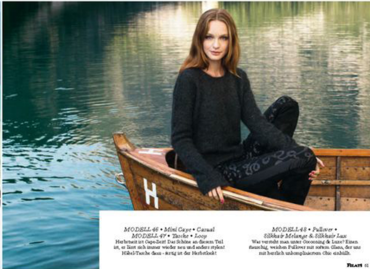
MODELLE 46 • Mini Cape • Casual MODELLE 47 • Tasche • Loop Herbstzeit ist Cape-Zeit! Das Schöne an diesem Teil ist, er lässt sich immer wieder neu und anders stylen! HÄSEL-Tasche klein - strig ist der Herbstlook!